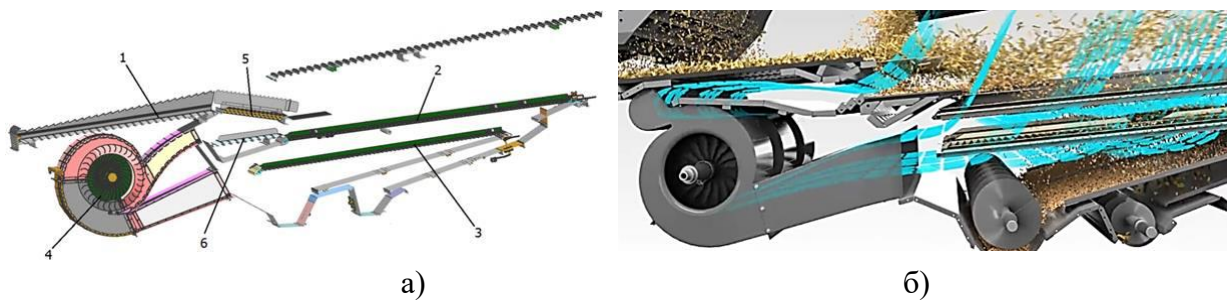
Рисунок 1 - Схемы очисток гибридных зерноуборочных комбайнов: а) по патенту RU 2 852 263 с наклонным решетом; б) Аналогичная без наклонного решета

В конструкции аналогичной системы наклонное решето отсутствует, зерновой ворох на сходе со стрясной доски через перепад поступает на предварительное решето, отдельный обратный патрубок от вентилятора направляет воздушный поток в зону активного воздействия на ворох.