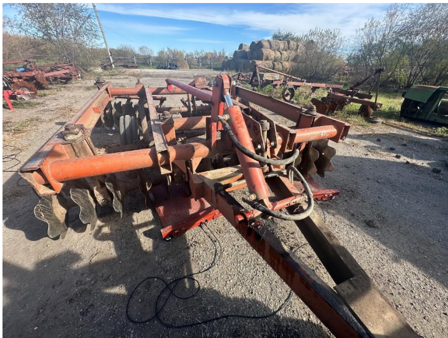
Рис. 5. Участок экспериментального определения силовых параметров рабочих элементов орудия БДТ-3