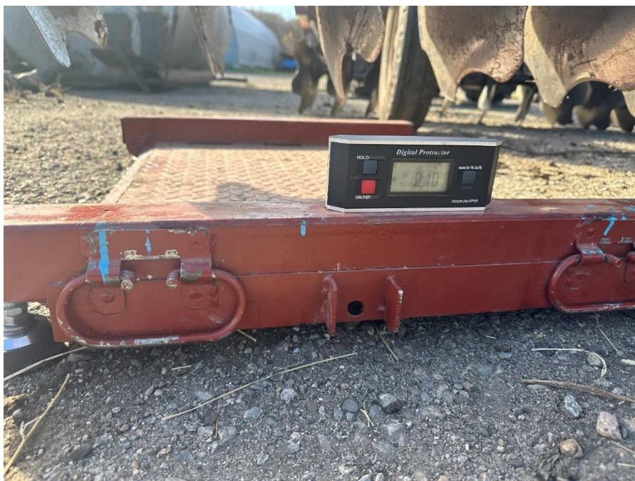
Рис. 4. Электронные платформенные весы