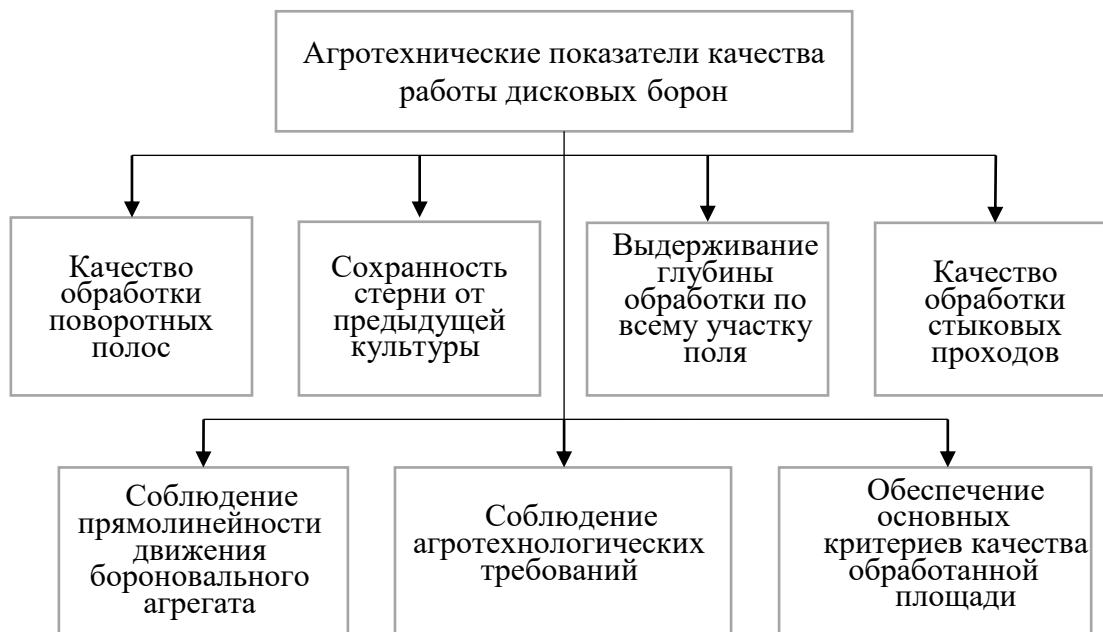
Рис. 1. Агротехнические показатели качества работы дисковых борон

Анализ агротехнических характеристик дисковых борон (рис. 1) свидетельствует, что качество обработки почвы определяется в первую очередь глубиной рыхления, степенью комковатости и ровностью поверхности поля.