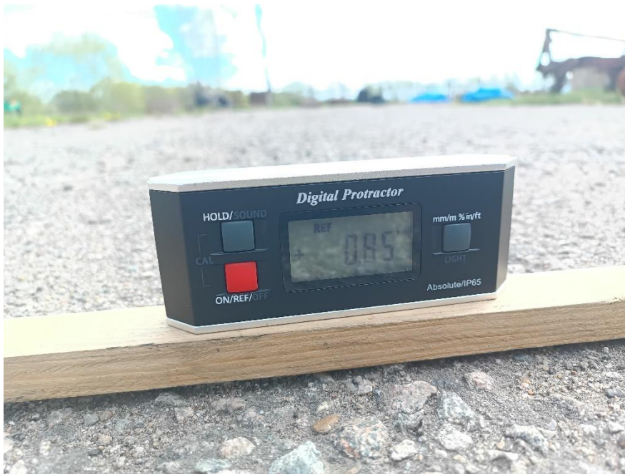
Рис. 3. Фрагмент определения угла наклона поверхности