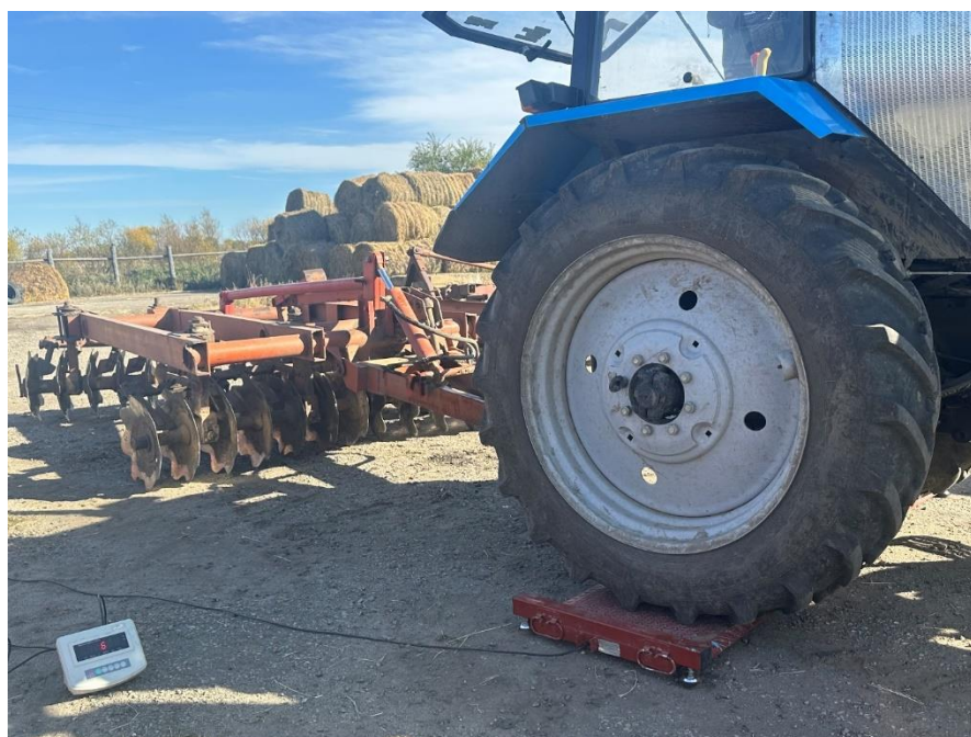
Рис. 6. Фрагмент определения силовой нагрузки на задние опорные поверхности (двигатели) трактора «Беларус 82.1»