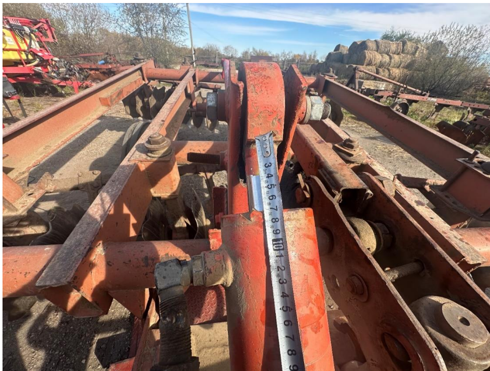
Рис. 7. Фрагмент определения длины выхода штока дополнительного гидроцилиндра

Как установлено в исследованиях [10,11], улучшение тягово-сцепных характеристик трактора напрямую зависит от увеличения сцепного веса, передаваемого на его ходовую часть. На основе данного положения были выполнены экспериментальные работы, целью которых являлась оценка влияния предлагаемого устройства на изменение вертикальных нагрузок на опорные элементы трактора «Беларус-82.1» (рис. 8).