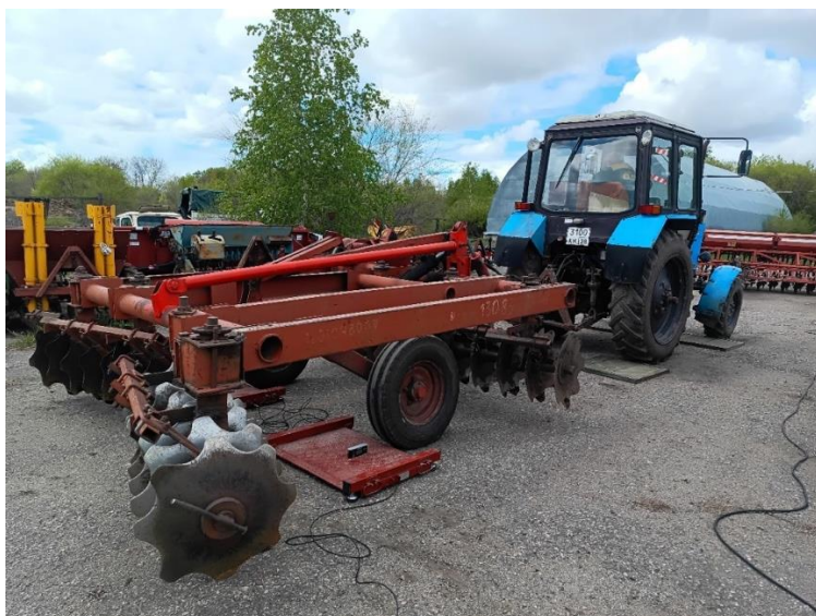
Рис. 2. Общий вид адаптированного бороновального агрегата

С целью улучшения конструктивно-технологических показателей бороновального агрегата, состоящего из трактора класса 1,4 («Беларус-82.1») и бороны тяжёлой дисковой БДТ-3, было предложено новое техническое решение, подтверждённое патентом РФ [7]. Предложенное техническое решение (рис. 2) позволило решить две главные проблемы, обозначенные выше, при подготовке почвы к посевным работам в весенний период при наличии мерзлотных очагов.