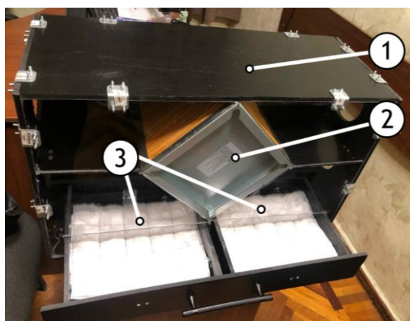
Рисунок 1 – Полноразмерная рекуперационная установка, оснащенная гидрогелиевыми абсорбирующими элементами: 1 – корпус, 2 – теплообменник, 3 – гидрогелиевые абсорбирующие элементы

В качестве примера реализации применения гидрогеля в подобных сельскохозяйственных сферах, выступает полноразмерная рекуперационная установка, оснащенная гидрогелиевыми абсорбирующими элементами [3], которые в данной модели выполнены в виде наполненных гидрогелем абсорбирующих элементов из тканевой мембранной оболочки, разделенных на ячейки (Рис.1).