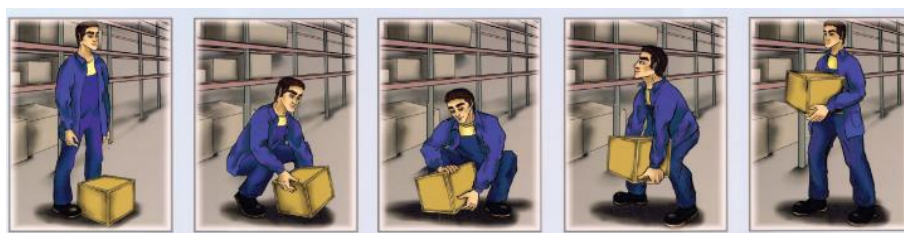
Рис. 4. Техника подъема груза.

По ручному инструменту выявлен средний риск ( R = 6 ). Необходимо соблюдать правила: