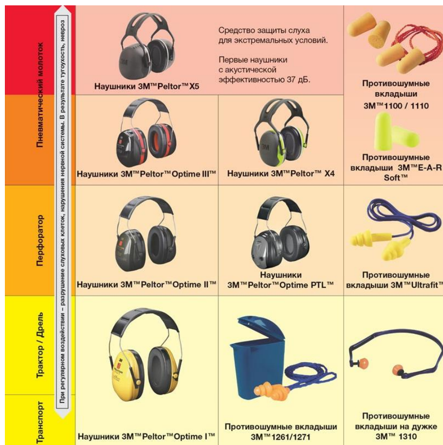
Рис. 5. Средства защиты слуха в зависимости от уровня шума.

Если вы, разговаривая нормальным голосом, плохо слышите друг друга на расстоянии около 2-х метров, это значит, что необходимо использовать средства защиты слуха. [7]