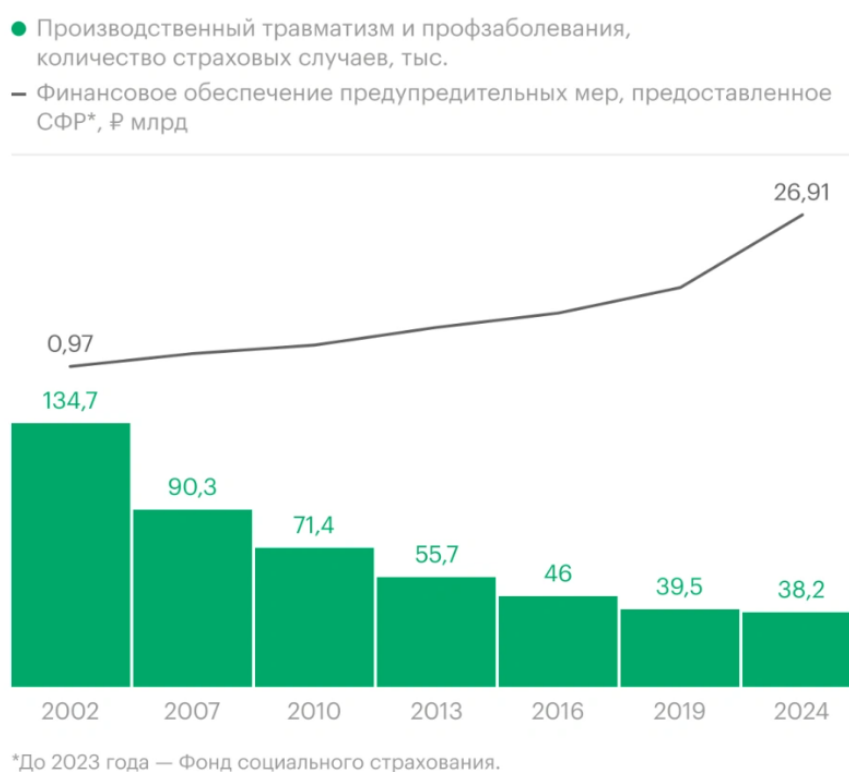
Рис. 1. Снижение производственного травматизма и профзаболеваемости по мере роста финансирования предупредительных мер [13]

производственного травматизма, что свидетельствует о положительном влиянии реализуемых мер по совершенствованию системы управления охраной труда. Вместе с тем статистика последних лет демонстрирует сохранение значительной доли тяжелых и групповых несчастных случаев, что указывает на наличие нерешенных проблем в области обеспечения безопасности труда.