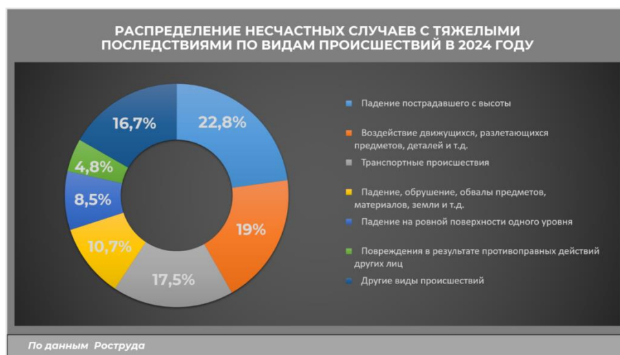
Рис. 2. Распределение несчастных случаев с тяжелыми последствиями по видам происшествий в 2024 году

происшествия – более 17,5 %. Данные показатели подтверждают необходимость дальнейшего совершенствования технических и организационных мер профилактики травматизма. [14]