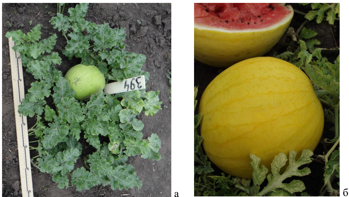
Рисунок 3 – Кустовая цельнолистная форма арбуза (а); кустовая форма арбуза с рассеченным листом (б)

Созданные кустовые и короткоплетистые линии проявили высокую адаптивность к экстремальным погодным условиям жары и засухи. Адаптивность их обусловлена хорошей облиственностью растений, которая обеспечивает лучшее сохранение влаги благодаря уменьшению испарения. Благоприятный микроклимат в посеве способствует высокой фотосинтетической активности растений, которая реализуется в величине и качестве урожая. Созданные изогенные линии представляют собой ценный генетический материал для селекции новых и улучшения существующих сортов.