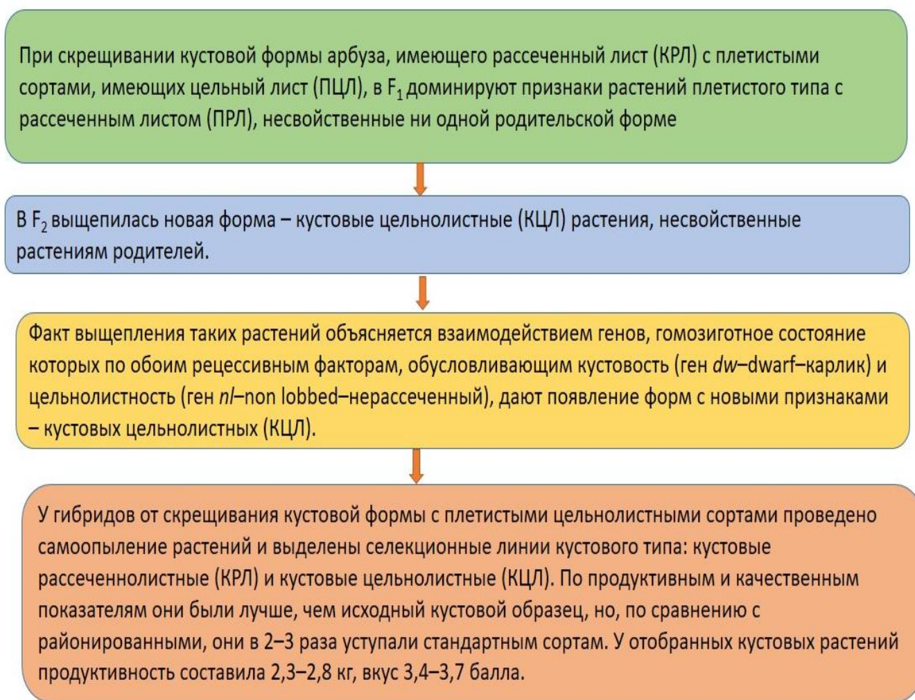
Рисунок 2 – Этапы создания гибридов разных поколений от скрещивания кустового образца с плетистыми сортами арбуза

На втором этапе проведено изучение гибридов разных поколений от скрещивания кустового образца с плетистыми сортами с целью получения более продуктивных и с лучшим качеством плодов кустовых растений, а также изучен характер наследования кустовости и других признаков у гибридов. Основные этапы второго процесса представлены на рисунке 2.