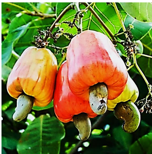
Рисунок 4 – Плоды кешью

Орехи кешью длиной около 2,5 см окружены скорлупой, которая содержит токсичное вещество урушиол, представляющего собой смесь нескольких производных катехинов, которые являются основными составляющими масла (рисунок 4).