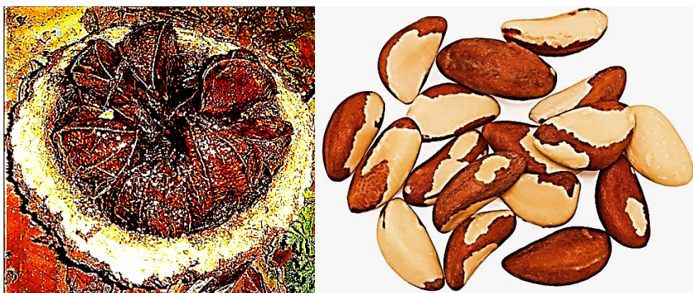
Рисунок 8 – Плод и ядра бразильского ореха

Плод бразильского ореха представляет собой крупную древесную «капсулу» массой 1,8–2,2 кг, в которой содержится от 10 до 25 отдельных орехов (рисунок 8).