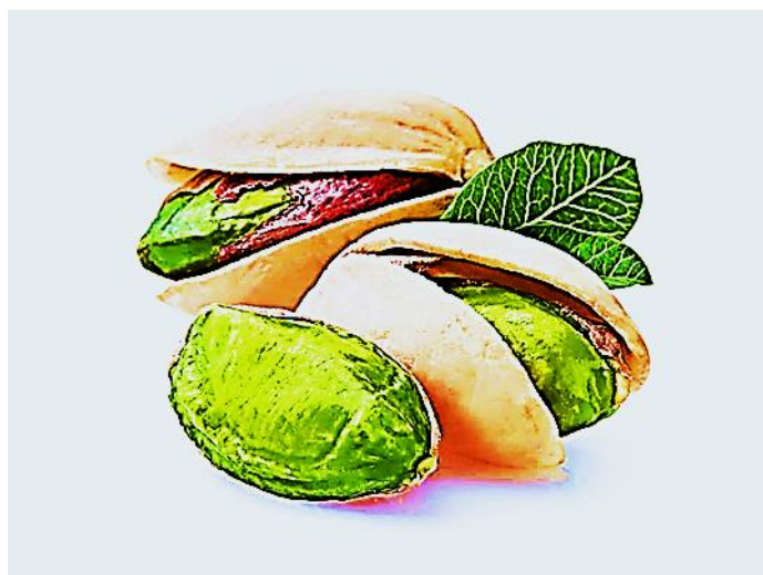
Рисунок 5 – Орехи фисташки

Это растение издавна известно своими уникальными орехами зеленого цвета, которые являются богатым источником белка, полезных жиров, клетчатки, многих витаминов и минералов, что делает их популярным продуктом здорового питания (рисунок 5).