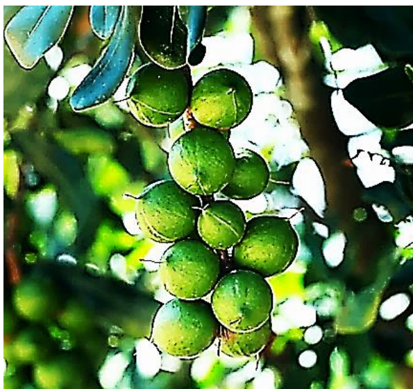
Рисунок 6 – Плоды макадамии обыкновенной (интегрифолистной)

Орехи макадамии имеют очень твердую скорлупу и богаты полезными жирами с высоким процентом мононенасыщенных жирных кислот. (рисунок 6).