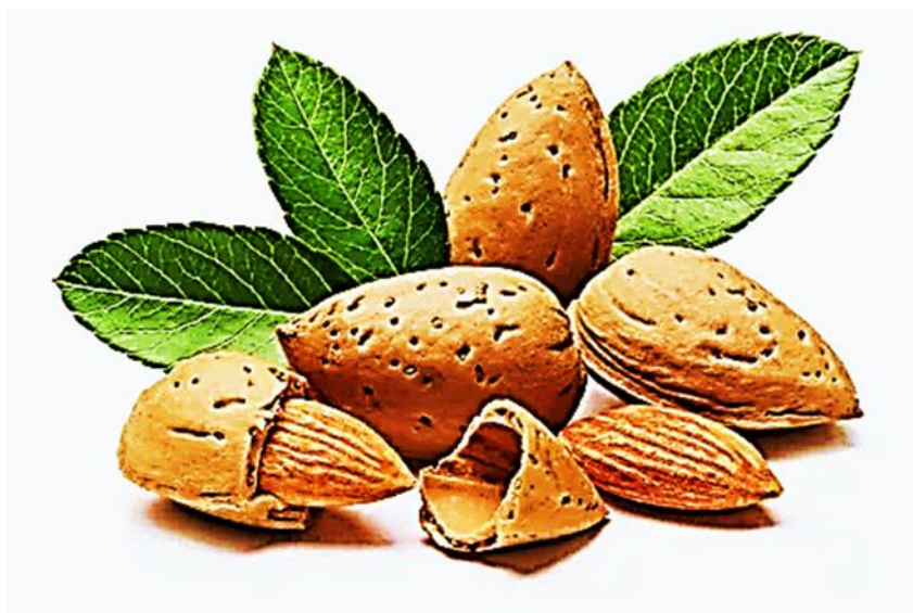
Рисунок 1 – Орехи миндаля

нем содержатся гипополидемические мононенасыщенные жиры, клетчатка и витамин E [2] (рисунок 1).