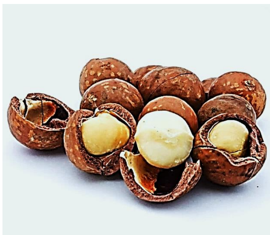
Рисунок 7 – Орехи макадамии

В 100 г орехов содержится 740 ккал обменной энергии и различные витамины группы В, а также кальций, калий, марганец, железо, магний, цинк и фосфор (рисунок 7). Орехи после прожаривания обычно используются в натуральном виде, выпечке и десертах.