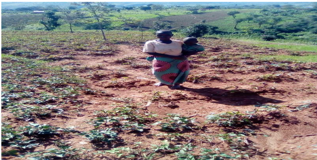
Рисунок 1 – Сельскохозяйственные земли в сельских домохозяйствах