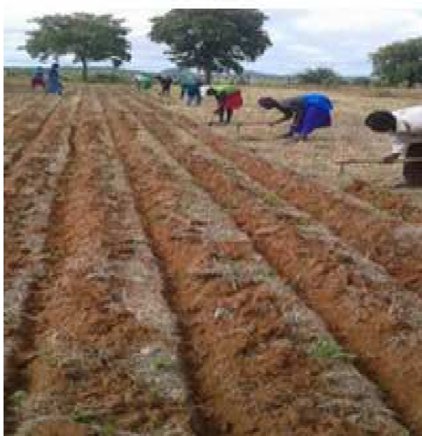
Рисунок 8 – Обработка почвы мотыгой