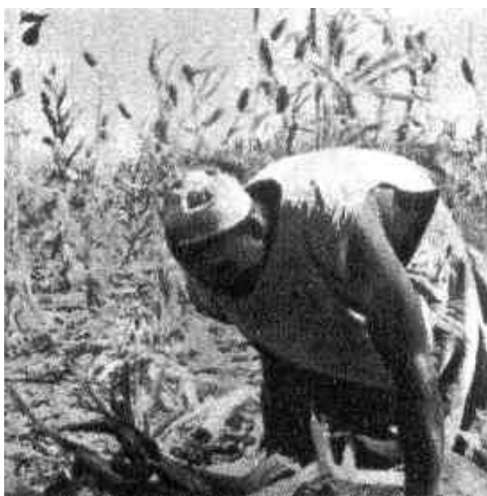
Рисунок 9 – Уборка сорго

Уборка сорго и послеуборочная его обработка производится при достижении полной зрелости зерна. При этом метелки срезаются ножом, складывают на брезент и сушат до полного высыхания зерна. После сушки вручную обмолачивают метелки и складывают зерно и солому в закрытых помещениях.