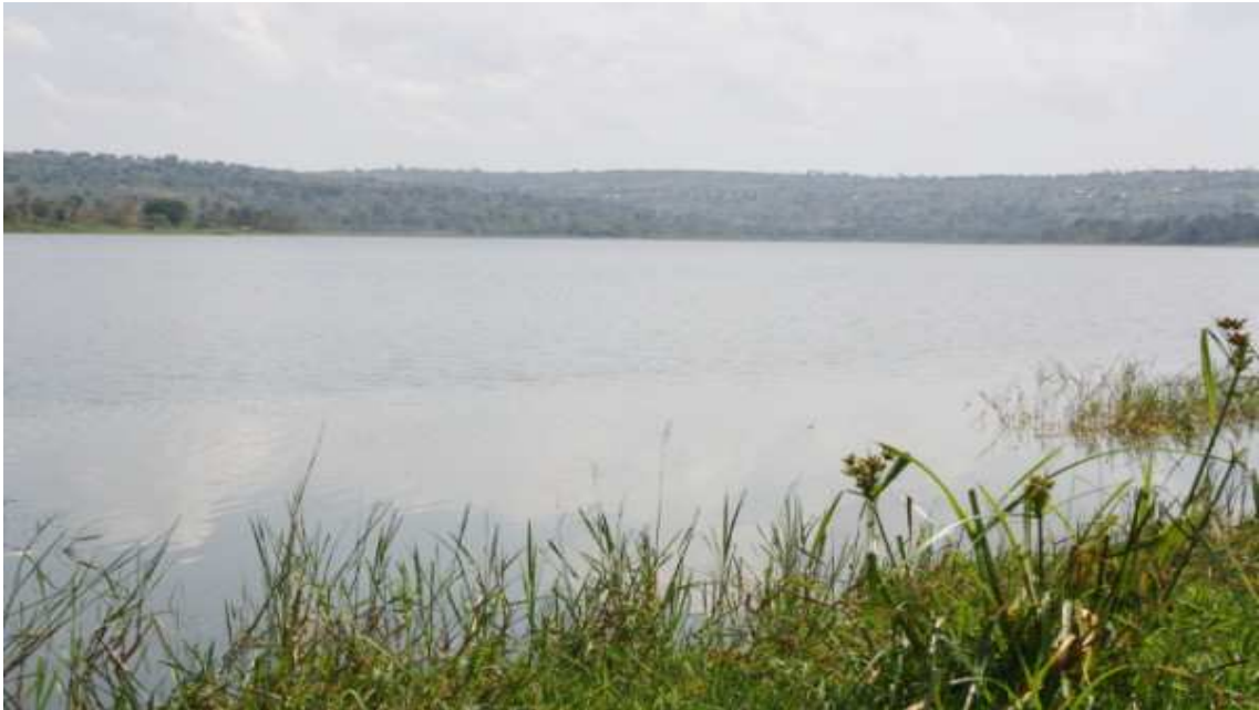
Рисунок 5 – Озер Рверу

Озеро Рверу расположено недалеко от самой северной точки Бурунди. Северный берег озера является частью границы Бурунди в провинции Кирундо. Это самая дальняя точка истока реки Нил.