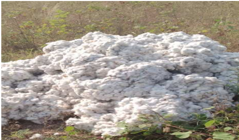
Рисунок 2 – Основные экспортные культуры в бурунди: кофе (а), чай (б) и хлопок (в)