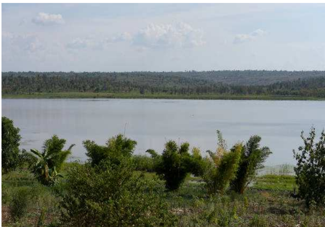
Рисунок 4 – Озеро Танганьика

Эти озера играют большую роль в сельском хозяйстве, потому что они являются источником воды, которая будет питать поля в летний период.