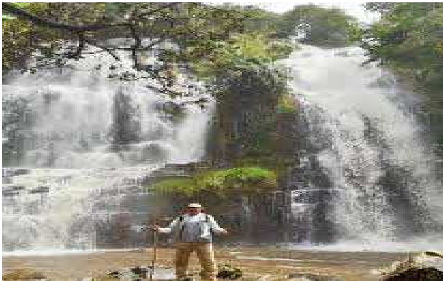
Рисунок 6 – Водопад Карера

Озеро Рверу расположено недалеко от самой северной точки Бурунди. Северный берег озера является частью границы Бурунди в провинции Кирундо. Это самая дальняя точка истока реки Нил.