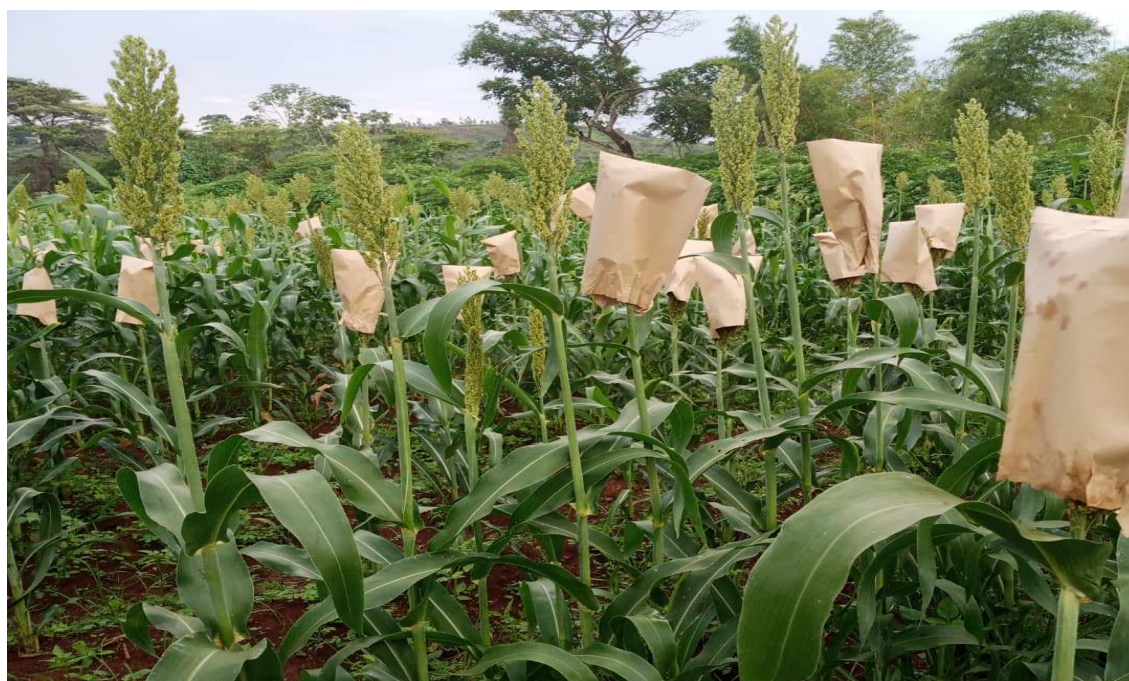
Рисунок 8 – Сортная очистка

В Бурунди программа исследований по выращиванию сорго началась в Институте агрономических наук Бурунди (ISABU) в 1967–1969 годах. Целью программы по выращиванию сорго является содействие развитию выращивания сорго во всех экологических зонах, благоприятных для выращивания этой культуры, в частности, в районах Имбо, Мосо, Бугесера и Буюгома. В других регионах Бурунди эта культура остается маргинальной. Первые исследования позволили распространить сорта красного сорго. Распространение белых сортов началось после 1980 года.