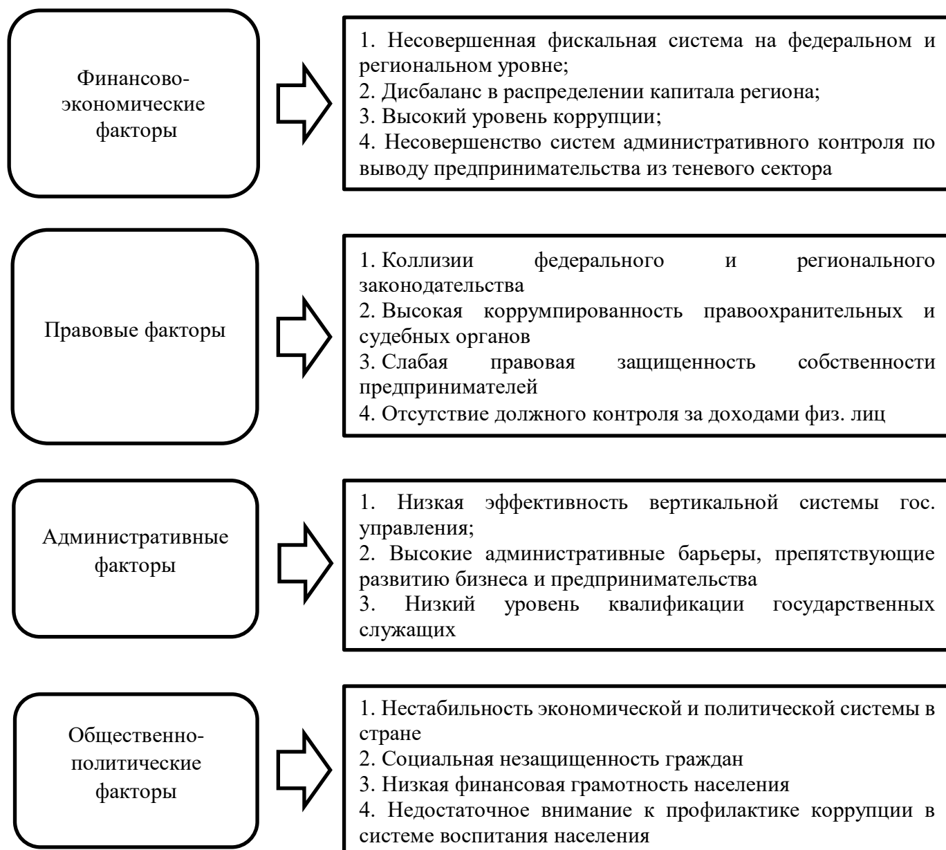
Рис. 1 – группы факторов, способствовавшие увеличению криминального сектора экономики

Проблемы, вызываемые теневым сектором экономики, носят системный характер, представляют угрозы для национальной и экономической безопасности, их решение требует реализации целого комплекса мер, затрагивающих все сферы жизнедеятельности, требующих совместной работы общества и государства.