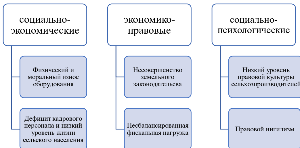
Рис. 2 – основные группы факторов, детерминирующих криминализацию АПК

Концептуальной целью криминализации экономики, в том числе агропромышленного комплекса, является извлечение сверхприбыли при наименьших затратах. Основными объектами криминальных посягательств в АПК являются: земля, недвижимое имущество, сельхозтехника, товарный знак, скот. Систематизация данных объектов позволяет выявить причины и способы криминализации в агропромышленном комплексе. Так, например, у большинства сельхозпроизводителей земля, как правило, находится в аренде, что дает возможность рейдерам, используя коллизионные моменты в действующем законодательстве, используя административный ресурс органов исполнительной и судебной власти, в судебном порядке расторгать договора аренды на землю, заключенные с муниципальными образованиями. Немаловажным представляется тот факт, что многие банки рассматривают землю в качестве залога при выдаче займов, в случае невозврата кредита земля не возвращается правообладателю.