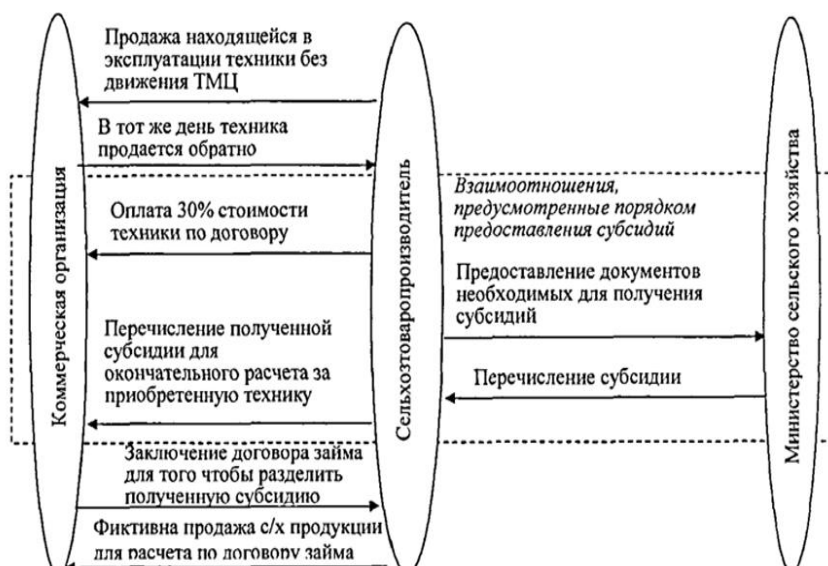
Рис. 3 – Схема хищения сельхозпроизводителями субсидий, выделенных на развитие АПК

развитие АПК. Несовершенство действующего законодательства, коррумпированность органов исполнительной власти, дают возможность сельхозпроизводителям совершать хищение и растрату бюджетных средств, предоставленных в рамках субсидирования (рис. 3). При выделении субсидий на приобретение минеральных удобрений сельхозпроизводители с целью хищения бюджетных средств создают фирмы-однодневки, как правило, аффилированные организации, через которые обналичивают денежные средства, используя фиктивные документы на приобретение удобрений. Существует также стандартная схема хищения при страховании урожая. Сельхозпроизводитель берет 100 % займа для оплаты страхового взноса у организации, аффилированной страховой фирме, при этом 70 % займа погашаются за счет страхового возмещения страховщика, а 30 % за счет субсидии, учитывая, что федеральный бюджет предоставляет субсидию в размере 50 % страхового взноса.