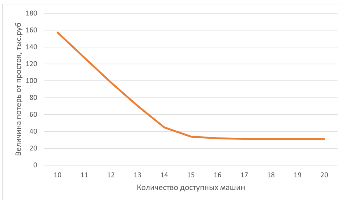
Рисунок 3 - Величина потерь от простоя техники при различном количестве максимально доступных транспортных средств для сценария Б (поля, рассредоточенные на расстоянии более 10 км от пункта разгрузки)

Как видно из рис. 3, при росте количества доступных транспортных средств величина потерь быстро снижается в диапазоне от 10 до 15 доступных транспортных средств, после чего становится практически неизменной. Более того при наличии 16 и более транспортных средств оптимальная модель задействует только 16 из них. Таким образом, явно прослеживается необходимость увеличения парка транспортных средств в ОАО «Дружба» для обеспечения эффективной загрузки имеющихся уборочных агрегатов. Альтернативным решением может стать комбинирование полей с различной удаленностью от пунктов разгрузки.