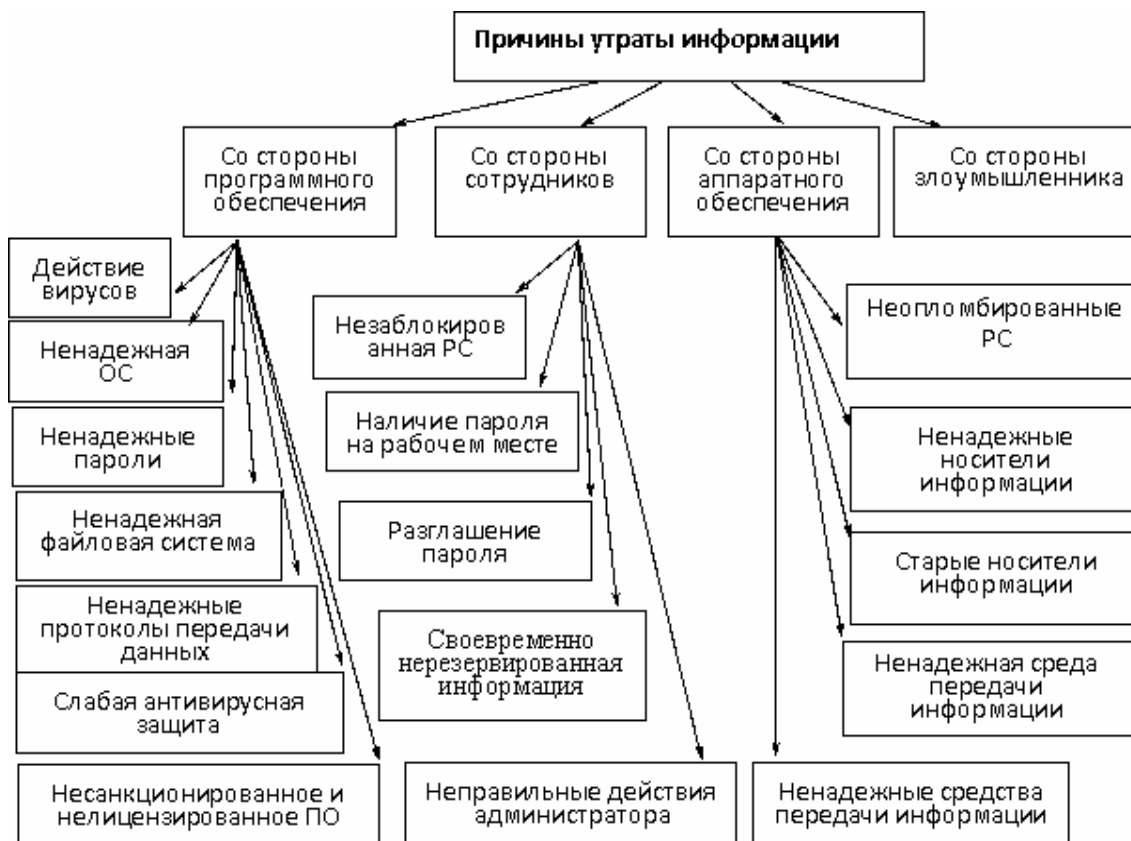
Рис.2 Классификация причин утраты информации, размещенной на PC

К внешним причинам относятся действие злоумышленника и вирусное воздействие. Внешнее воздействие обуславливается попытками сторонних лиц получить доступ к конфиденциальной информации, причины подобных попыток могут быть разнообразны. Воздействие вирусов может стать причиной: несанкционированной передачи информации по сети; удаления данных с компьютера, изменения данных, форматирования жесткого диска.