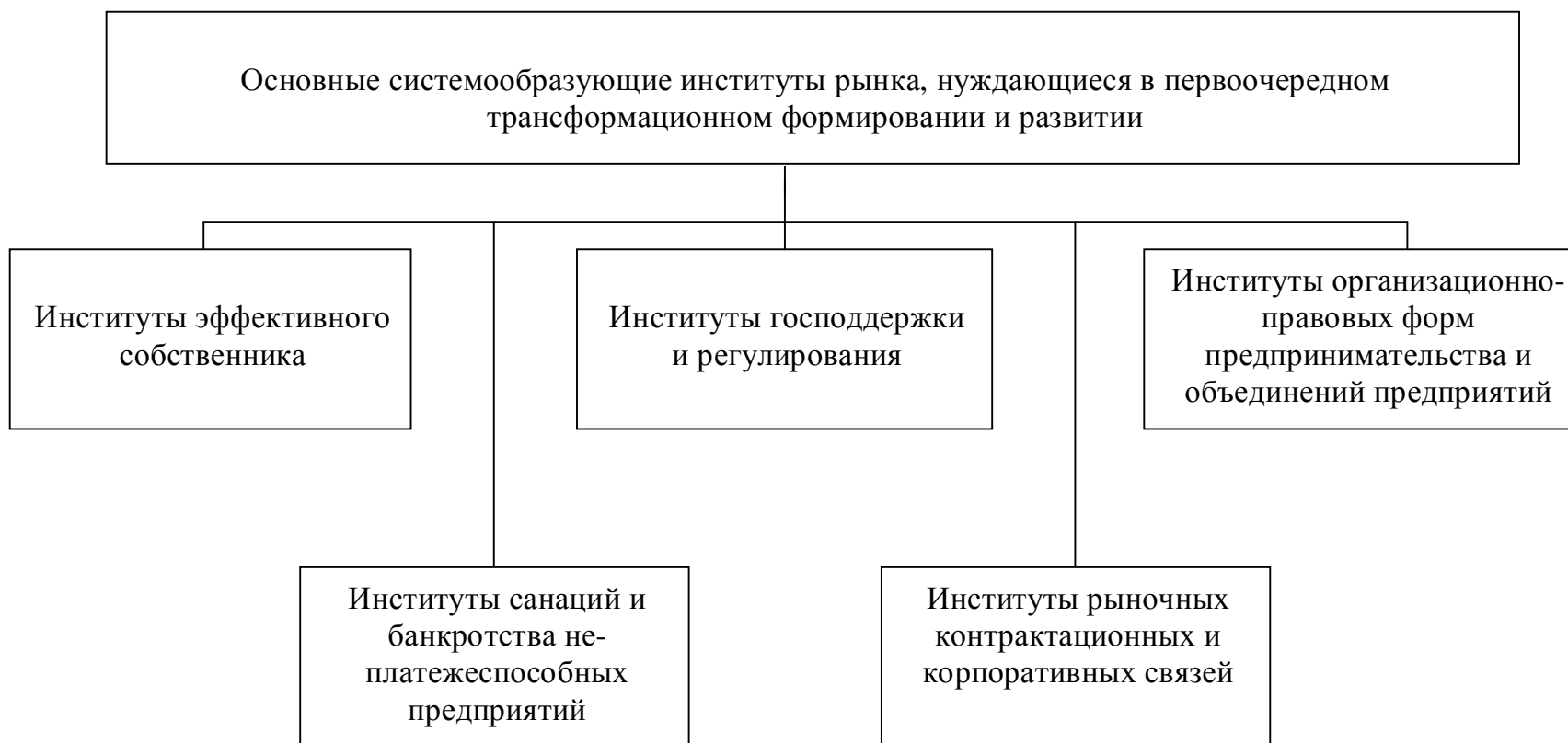
Рисунок 1 – Основные системообразующие институты рынка, нуждающиеся в первоочередном трансформационном формировании и развитии (составлено автором)