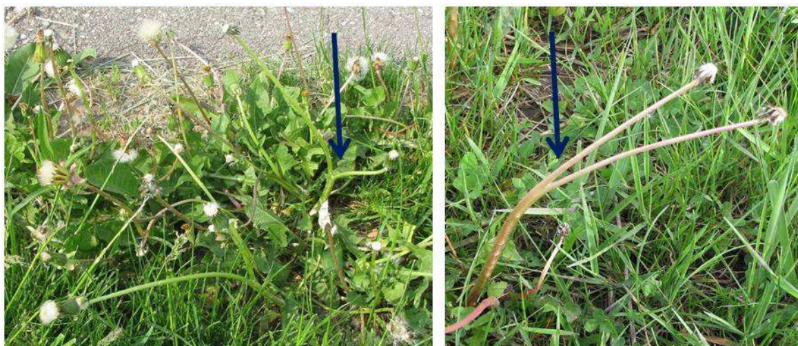
Рисунок 3 – Частичное срастание цветочной стрелки у одуванчика лекарственного. Ресурсу сети Internet.

Причин появления фасцированных растений одуванчика может быть несколько. К первой можно отнести тот факт, по мнению А. А. Федорова, это семейство и вид «способно к фасцированию» [6]. Появление в природе одуванчиков с фасциями может быть обусловлено воздействием окружающих условий на растение.