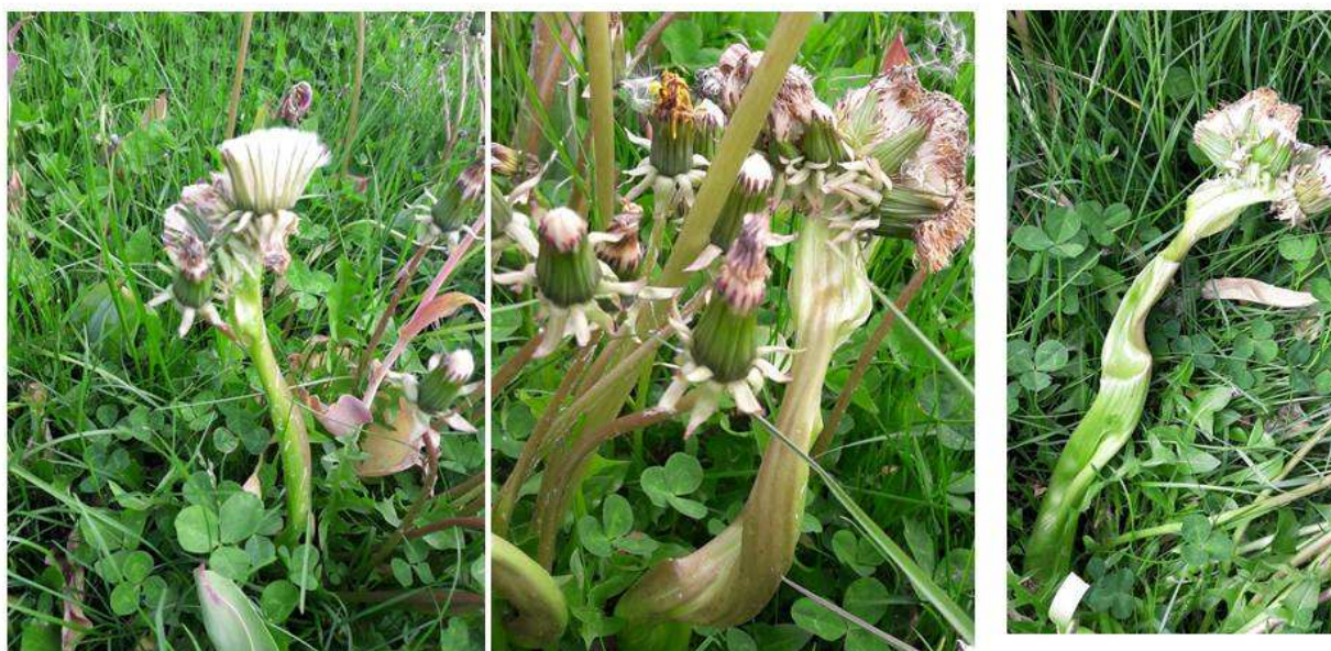
Рисунок 5 – Растения одуванчика с фасциированной цветочной стрелкой и соцветием по всей длине, количество сросшихся растений семь . На растении две цветочные стрелки с фасциацией, Кобленц, 2017 г.

Третьей причиной является механическое повреждение цветочной нити во время стрижки газонов. В течении трех лет наблюдалось множественное появление растений одуванчика лекарственного на газонах с укороченными сросшимися цветоносными стрелками от четырех, пяти и более в одном органе (рисунок 6) .