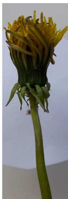
Рисунок 8 – Цветоносная стрелка фасцированного одуванчика и основание корзинки, состоящее из двух частей. Одна часть сросшаяся из 3-4 соцветий, вторая нормальная, но сросшаяся с основной; б нормальная и фасцированная основа корзинки соцветия одуванчика; в – фасцированное соцветие из нескольких корзинок в стадии образования семян, Кобленц, 2017 г.