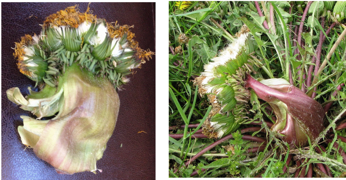
Рисунок 6 – Растения одуванчика лекарственного с фисциацией после стрижки газонов, Краснодар, 2015-2017 гг.

Изучение фасциации у одуванчика позволяет проанализировать особенности развития этих растений, развивает наблюдательность. Сравнение нормы и отклонения выявляет закономерности онтогенеза. У фасцированных растений одуванчика при срастании соцветия наблюдается растянутое цветение, в множественной корзинке оно начинается с краев к центру (рисунок 7); другой случай – одна корзинка цветет, другая находится в стадии бутона (рисунок 2, в).