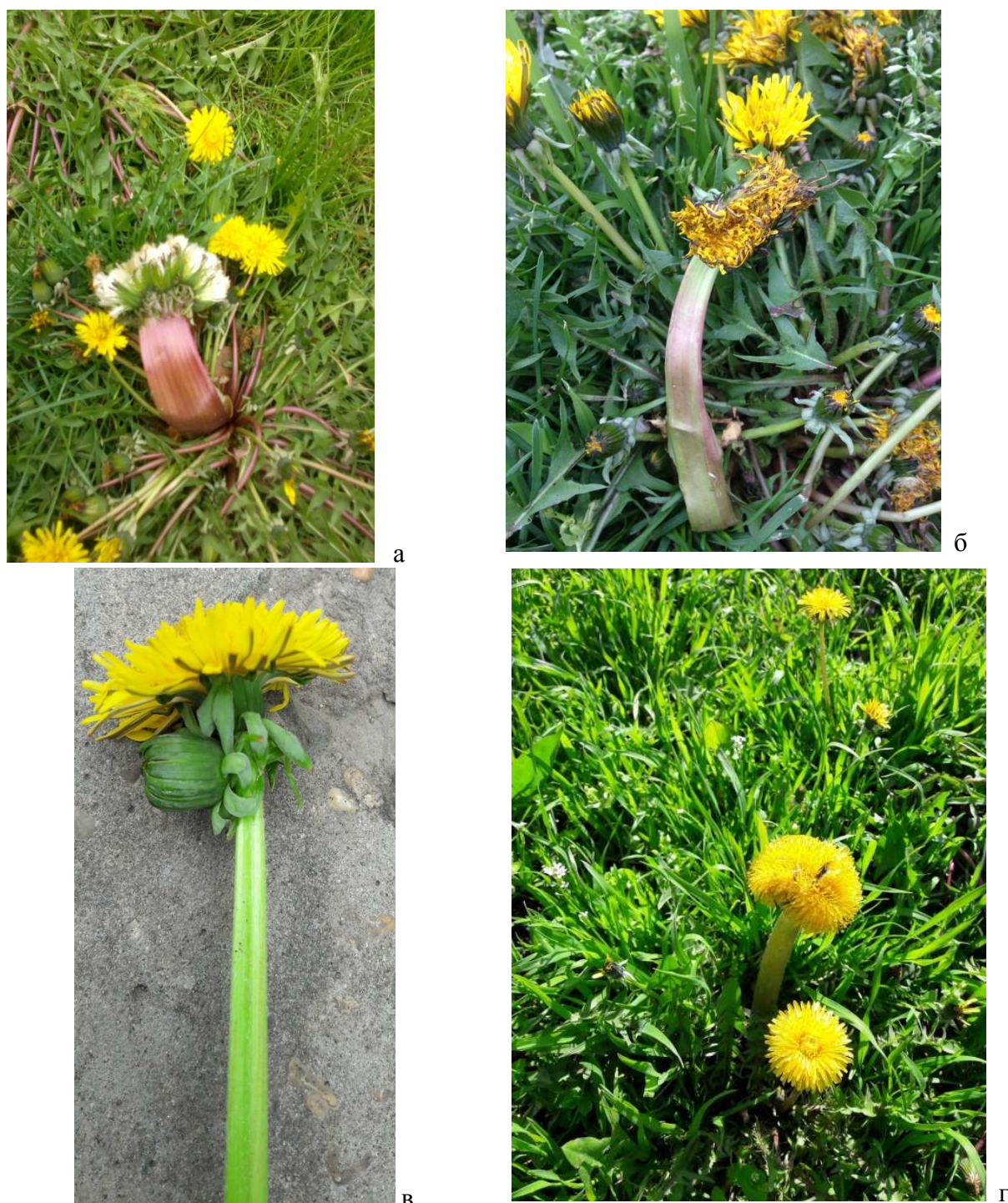
Рисунок 2 – Различные типы фасциаций у одуванчика лекарственного: а, б – срастание нескольких растений от 3 до 7; в – срастание двух растений и разное время цветения (одно соцветие цветет, другое еще в стадии бутона); г – срастание двух и более растений. Краснодар, 2015 –2017 гг.