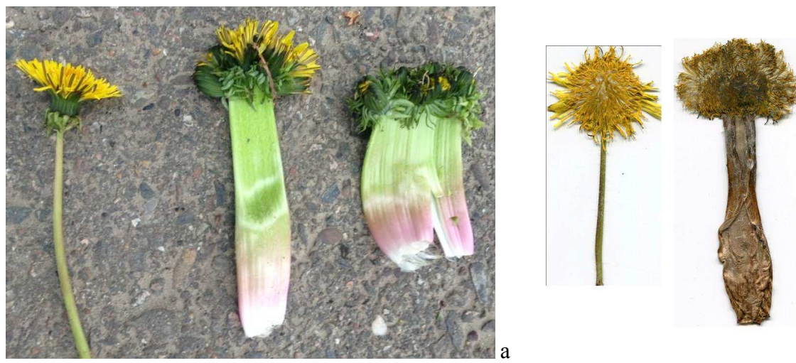
Рисунок 4 – Различные типы срастаний: а – слева направо: цветочная стрелка и корзинка в норме; срастание трех цветочных стрелок и корзинок, срастание пяти и более цветочных стрелок и корзинок; б – гербарные образцы растения в норме и растения с фасциацией. Краснодар, 2015 г.