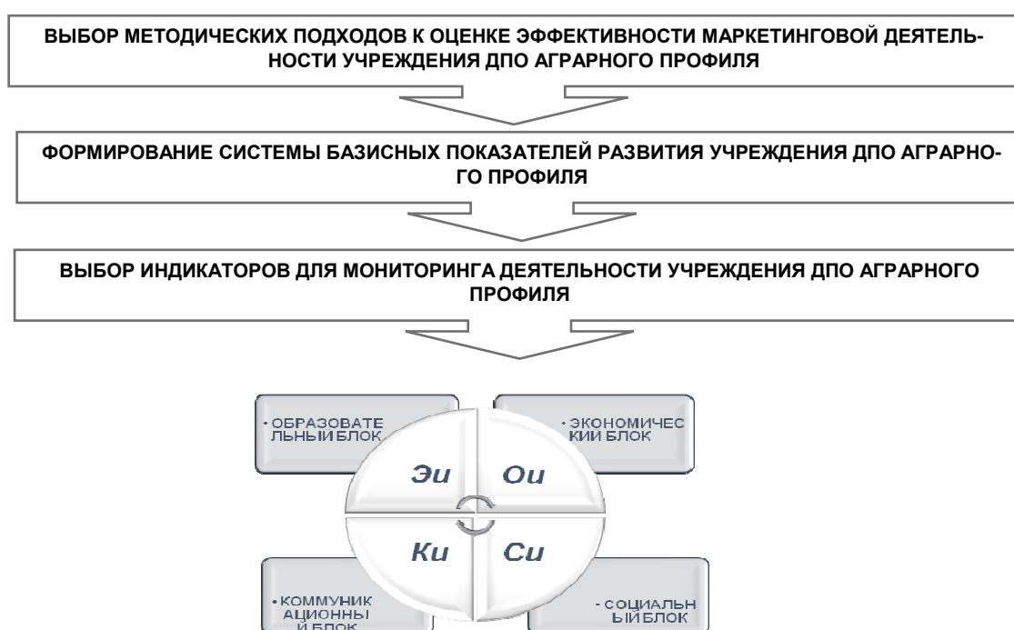
Рисунок 1 - Методические подходы к оценке маркетинга образовательных услуг