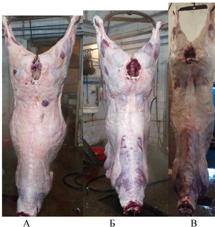
Рисунок 1 – Туши бычков различных пород (возраст 18 мес.) А – абердин-ангусская, Б – шаролезская, В – кубанский тип

Результаты и обсуждения. В результате проведенных нами исследований установлено, что туши животных мясных пород изучаемых генотипов были тяжеловесные и отличались хорошо обмускуленной спиной (рис 1).