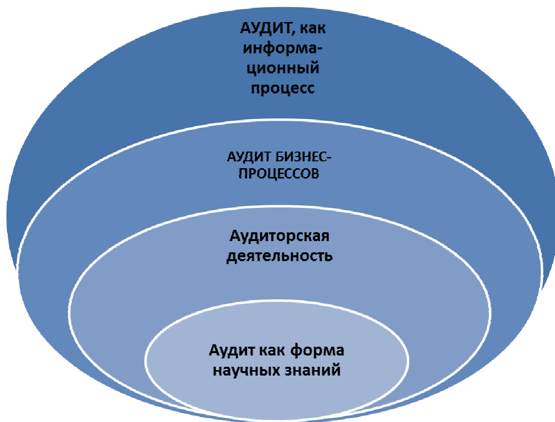
Рисунок 1 – Парадигма аудита, учитывающая концепции его развития

Далее на базе сформулированной парадигмы обосновывается концепция развития аудита, которая будет отвечать современным требованиям общества (рисунок 1).