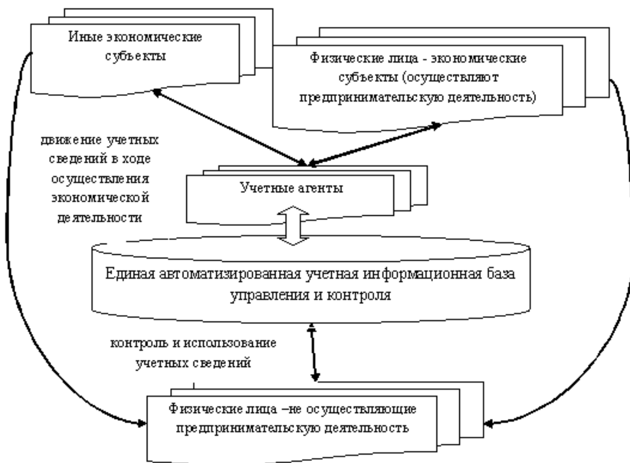
Рисунок 2 –Схема движения учетных сведений в формате предлагаемого единого учетного пространства с участием физических лиц

подписан Федеральный закон от 04.11.2014 № 348-ФЗ, который вводит поправки в Налоговый кодекс Российской Федерации (далее – НК РФ) [3].