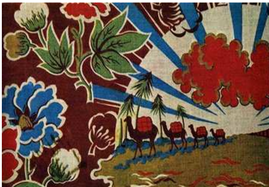
Рисунок 6– Ткани времен СССР. Изображен хлопок, который выращивали в республиках Средней Азии.

Агиттекстиль просуществовал недолго, около 15 лет. Он исчез из использования в 1933 году. Несмотря на то, что он обладал множеством достоинств: интересный рисунок, художественное выполнение образов, яркость красок, тематический текстиль оказался ненужным в годы завершения «построения основы социализма». К сожалению, сегодня образцы тканей сохранились только на фабриках, где выпускался этот материал, да и то, в музейных фондах. С другой стороны, вещи из агитационного текстиля в отличие от книг или плакатов, не хранились долго. По мере того, как изнашивалась ткань, ее просто выбрасывали и использовали как ветошь.