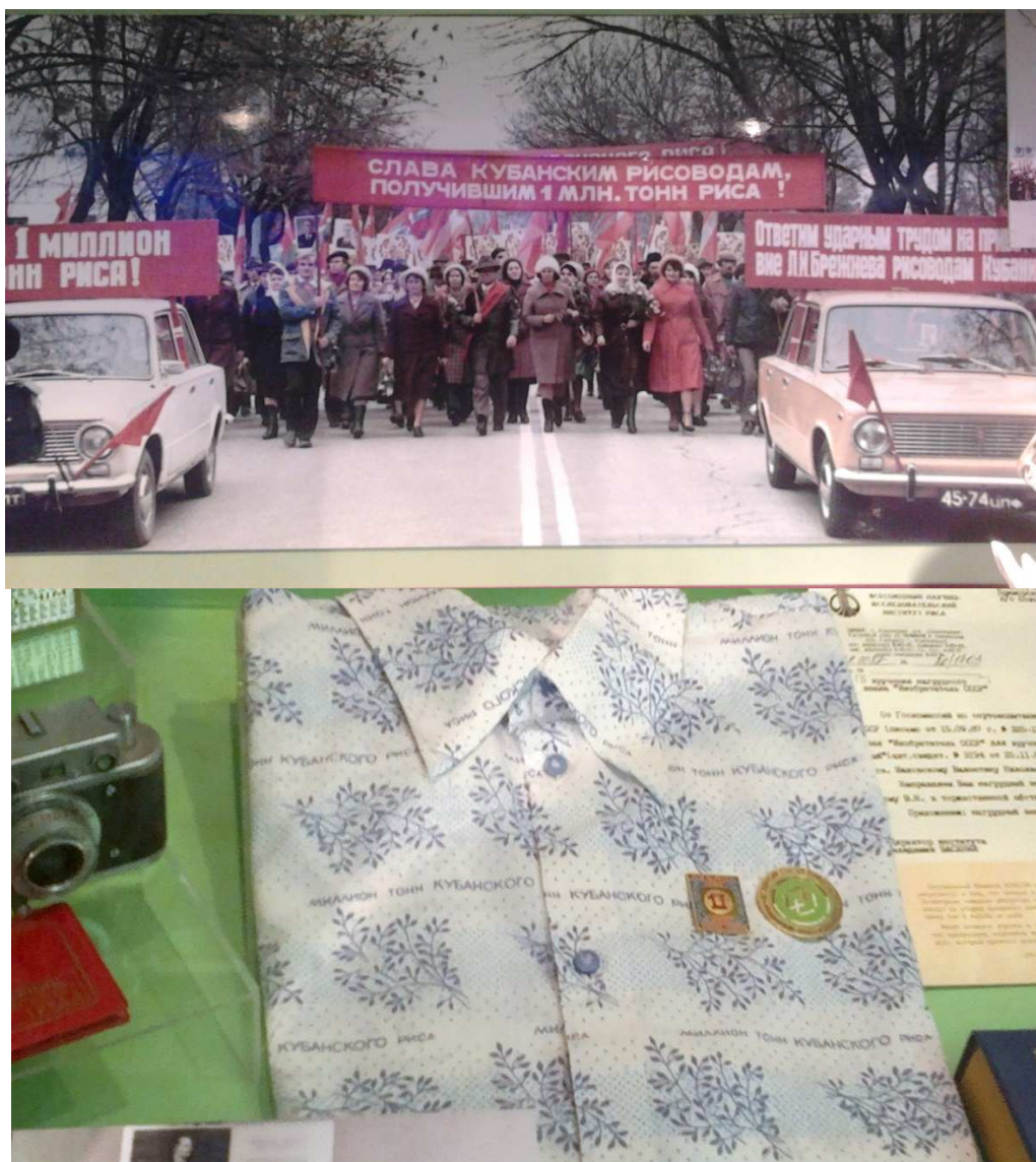
Рисунок 7– Фотография с демонстрации. Сотрудники ВНИИ риса на демонстрации, г.Краснодар (фото сверху), рубашка из агитационного текстиля (фото снизу). Материалы из музея ФГБНУ Всероссийского научно-исследовательского института риса, г.Краснодар, п.Белозерный.

СССР и около половины в России. Была поставлена задача – вырастить 1 миллион тонн риса на рисовых полях Кубани. Программа была столь масштабной, что кроме строительства оросительных систем, расчистки полей под посевы риса, создание новых сортов, большое внимание уделялось агитации и популяризации этой программы. Вот тогда и были создана ткань с простым рисунком и надписями «1 миллион тонн Кубанского риса». Из тематического ситце были пошиты рубашки, постельное и нижнее белье (рисунок 7).