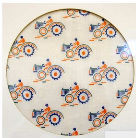
Рисунок 1– а) Неизвестный художник. Образец ткани «Трактора», 1930. Большая Иваново-Вознесенская мануфактура. Фланель, Механическая печать; б) Художник Сергей Бурюлин. Образец ткани «Трактористы», 1930. Хлопок, прямая печать. «100 % Иваново».