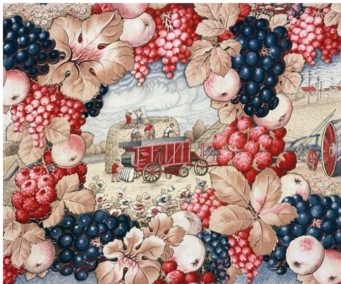
Рисунок 4 – Иванова, революционный ситец. Художник В.Маслов.

Тематический текстиль или декоративный текстиль включал в себя принцип плаката(рисунок 5) [8]. Опасность прямого переноса плакатного принципа на ткань справедливо заметил Д. Аркин. Он поставил принципиальный вопрос о различии характера восприятия, да и самого использования декоративной ткани и плаката. Плакат, - писал Д. Аркин, - никогда не рассчитан на длительное применение, - в этом его сила, острота. Текстиль рассчитан на длительное применение. Плакатный рисунок здесь надоест.