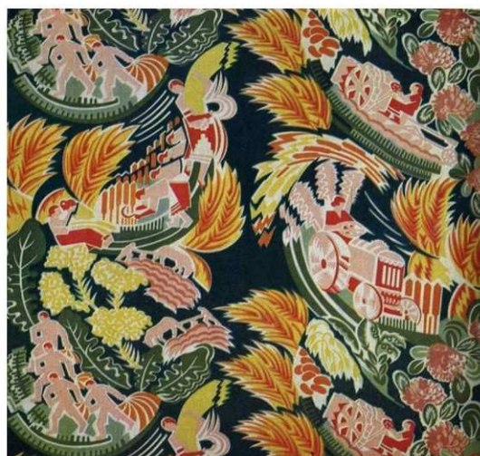
Рисунок 3 – Ситец, созданный в 1930 годах. Тематика – уборка урожая.

В 30-х годах создаются декоративные ткани и эмблемные платки (настенные, носовые) с сюжетными изображениями. Художнику Тейковской фабрики Ивановской области В. Маслову принадлежит рисунок ситца со сценами сельскохозяйственных работ в обрамлении крупных гирлянд из плодов и листьев (1924 год). Изображение пейзажа, трактора, лошади, передаются объемно, пространственное, со светотеневой проработкой.