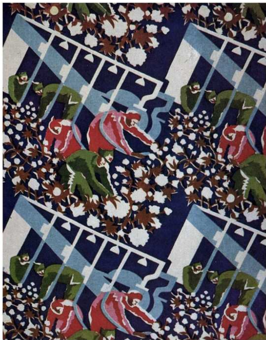
Рисунок 5 – Авангардные советские ткани начала XX века.

Рисунки на советских тканях содержат агитационные символы и идеи СССР, вместе с тем, принты на тканях начала 20 века отражают авангардное искусство, вбирая в себя идеи художников того времени.