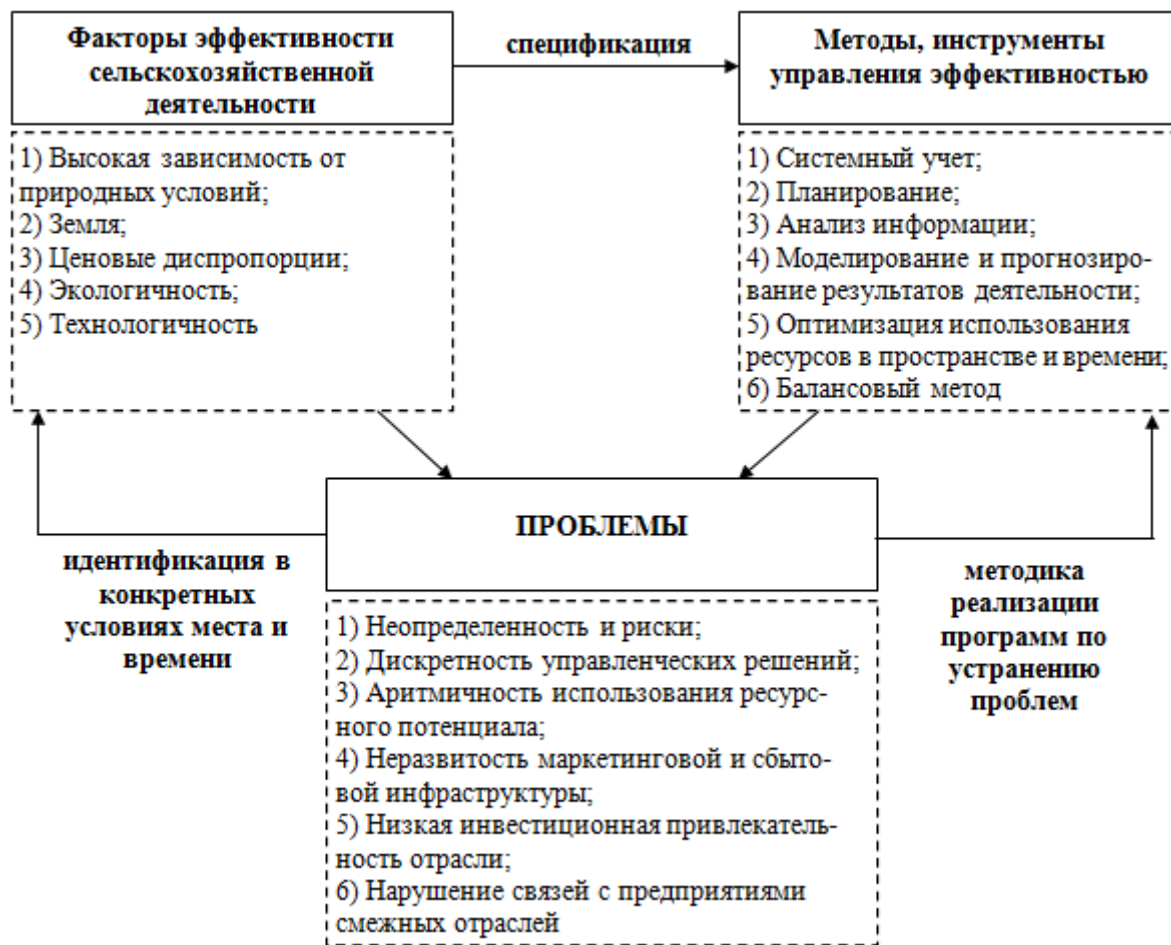
Рисунок1 – Проблемно-ориентированный подход в управлении эффективностью сельскохозяйственного производства

Инструментом для практической реализации рациональной системы хозяйствования в сельском хозяйстве служит организационно-экономический механизм, который должен включать все аспекты хозяйственной деятельности общества – все элементы производительных сил (в части их организации и механизмов функционирования) и всю систему производственных отношений.[4] Организация и управление национальным хозяйством, включающим все его элементы, являются сутью хозяйственного механизма. Законы управления хозяйственными процессами охватывают всю экономическую структуру общества, а также управление людьми, как главным звеном производительных сил и субъектом производственных отношений.