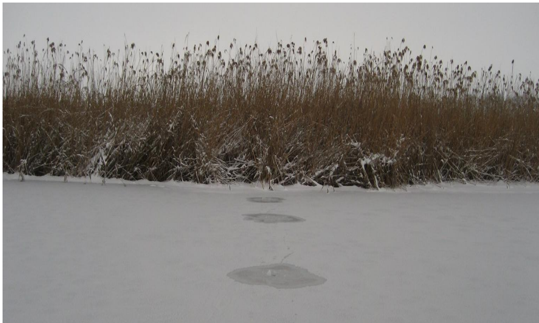
Рисунок 7 Русловые берега р. Журавка крутые, высотой 0.3 \div 0.5 \text{ м} , заросшие тростником.

вень воды выше меженного, у разрыва плотины полынья с течением, где был измерен расход воды, составляющий 0.662 \text{ м}^3/\text{с} . Ширина реки на участке перехода 83-87 м, глубина на участке перехода 2.6 м. Вода прозрачная, дно реки ровное, заиленное.