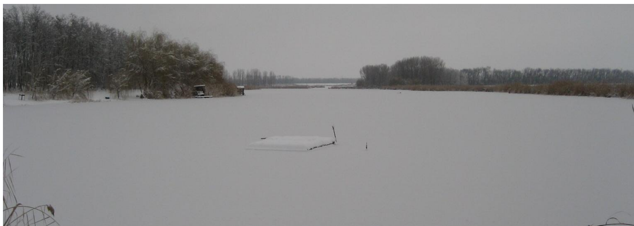
Рисунок Ошибка! Текст указанного стиля в документе отсутствует. Пруд реки Очеретовая Балка, правый приток р. Бейсужек Левый

Выше плотины балка представляет собой большой пруд.