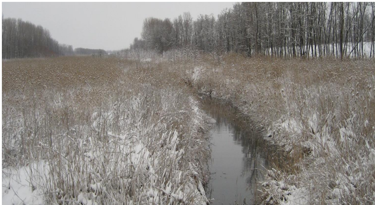
Рисунок 5 Река Очеретовая Балка, правый приток р. Бейсужек Левый

Ниже плотины русло слабоизвилистое, искусственно углубленное.