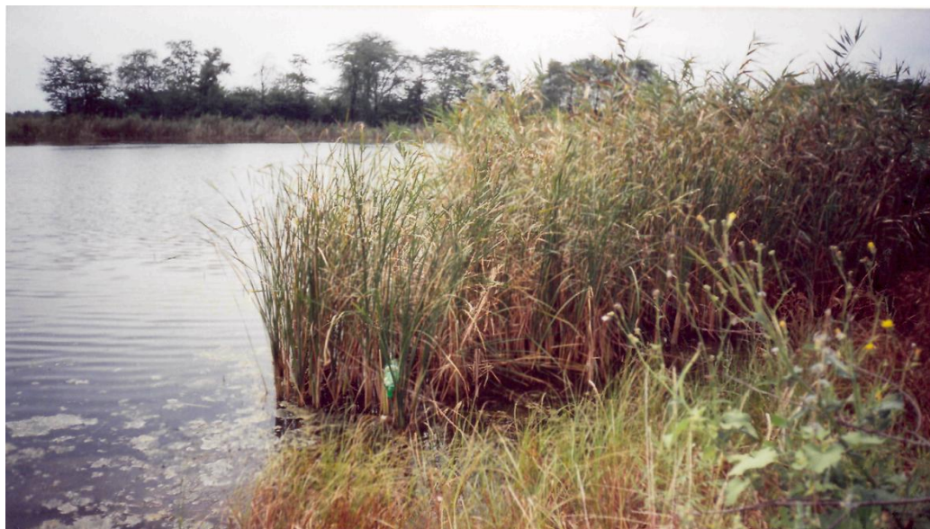
Рисунок 1 Река Ея и зарастание её берегов

После проводимых исследований студентами бакалаврами и магистрами кафедры общей биологии и экологии Кубанского государственного аграрного университета, установили, что режим равнинных рек характеризуется весенним половодьем, но значительно нарушен большой зарегулированностью временными плотинами [8]. Основным источником питания служат атмосферные осадки и грунтовые воды. Весеннее половодье обычно наступает в марте, реже в последней декаде февраля или начале апреля. По мере продвижения к югу сроки половодья сдвигаются на более ранние. Максимальная высота подъёма уровня весеннего половодья обычно наблюдается в конце марта – начале апреля и достигает на малых реках в среднем 3 м. На реках Бейсуг, Бейсужек Левый, Челбас подъём уровней весеннего половодья не превышает 1-1.5 м. Половодье отличается резким подъёмом уровней, достигая максимума за 4-5 дней. Максимальное стояние уровней наблюдается всего 5-6 часов, после чего наступает медленный спад. Продолжительность половодья на реках этого района различна, в среднем она достигает 1-2 месяца, к югу значительно сокращается. Заканчивается половодье обычно в конце апреля – первой половине мая [8]. Го-