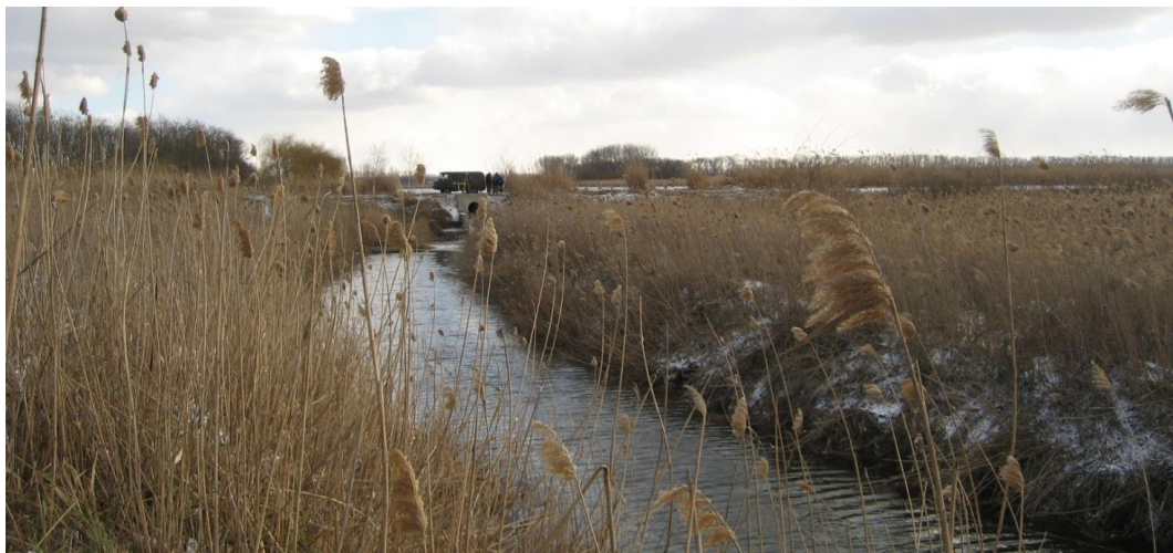
Рисунок 3 Створ перехода реки Очеретовая Балка, правый приток р. Бейсужек Левый

следования 7 м и глубиной 2.3 м (рис.4.8). Русловые берега крутые, местами обрывистые, высотой 0.5 м.