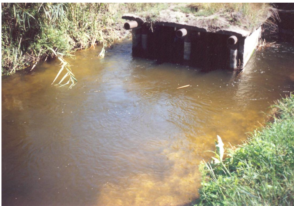
Рисунок 2 Река Челбас в посёлке Большие Челбасы

Практически все водотоки равнинной части зарегулированы на всём протяжении системой земляных плотин, разделяющих водотоки на цепь отдельных прудов, расположенных через каждые 3-4 км (рис 2). Часто пруды разобщены друг от друга участками сухого русла [7].