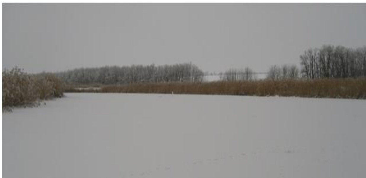
Рисунок 6 Ниже участка перехода река Журавка перегорожена земляной плотиной

В 200 м ниже участка перехода река Журавка перегорожена земляной плотиной, в створе перехода образован пруд (рис. 6). Плотина не сплошная, у левого берега разрушена.