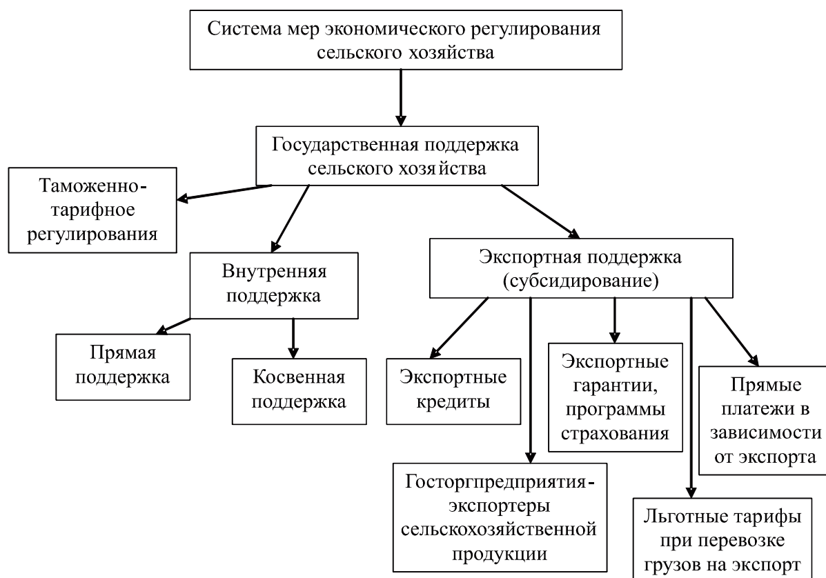
Рисунок 2 - Внутренняя поддержка в системе мер государственного регулирования

создание условий для развития сельского хозяйства внутри страны, в частности два больших блока мер прямой и косвенной поддержки (рисунок 2).