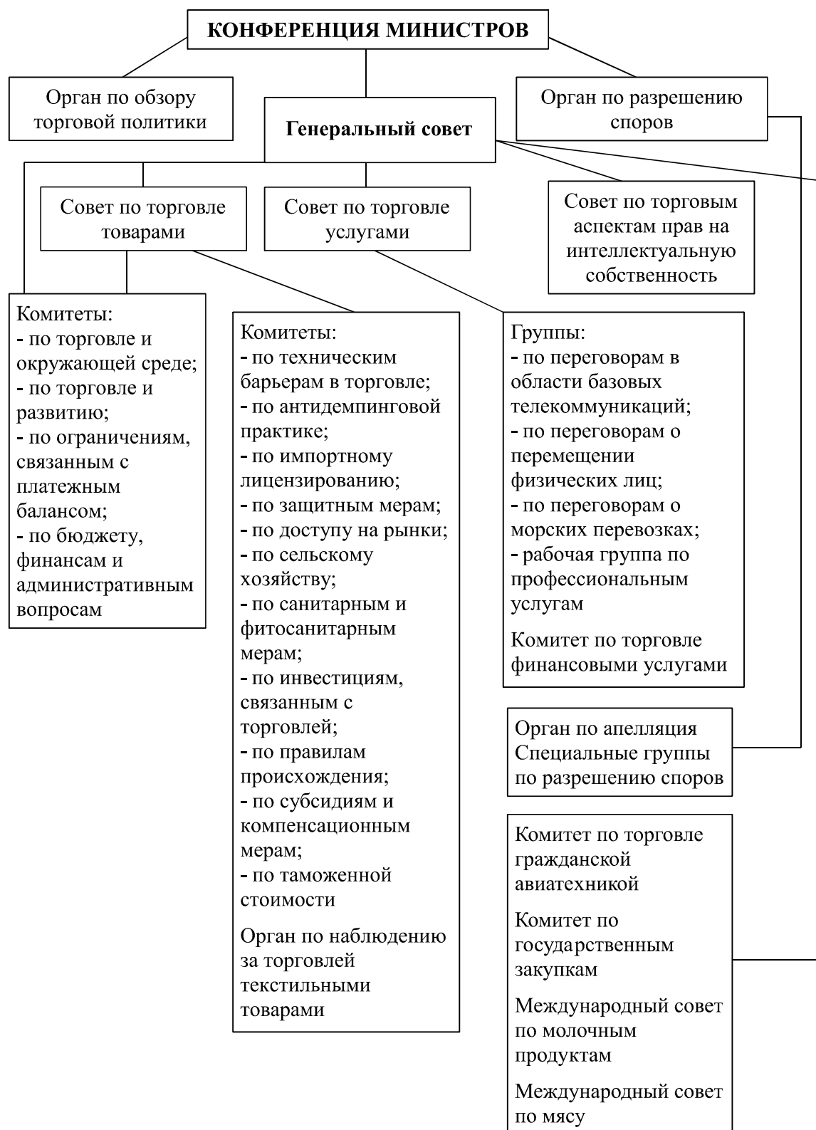
Рисунок 1 - Организационная структура конференции Министров ВТО