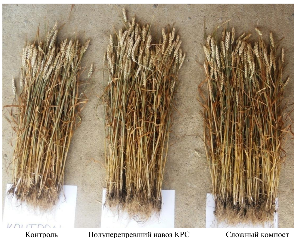
Рис. 5. Последействие компоста в полевом опыте озимой пшеницы в период её созревания (II декада июня 2012 г): количество побегов на 1 м 2