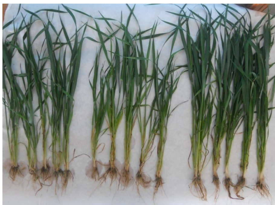
Контроль Полуперепревший навоз КРС Сложный компост