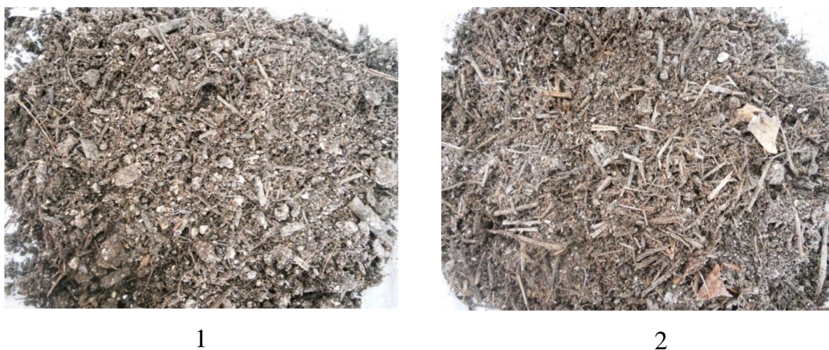
Рис. 1. Сложный компост с включением растительных отходов:

По скорости разложения растительные остатки в компостах в осенне-зимне-весенний период можно расположить в следующий ряд: сахарная свекла → озимая пшеница → кукуруза → подсолнечник → озимый ячмень. Остатки свеклы минерализовались полностью, и сформированная масса сложного компоста была однородной без их четкого разделения. В остальных вариантах опыта визуально отмечено наличие остатков неразложившихся стеблей, а в некоторых случаях и полуразложившихся листовых влагалищ, особенно у кукурузы и озимого ячменя. Во всех вариантах отмечена хорошая агрегированность сформированных компостов, отличающихся пористой мелкозернистой структурой, сыпучестью и устойчивой влажностью на уровне 15-20% (рис. 1).