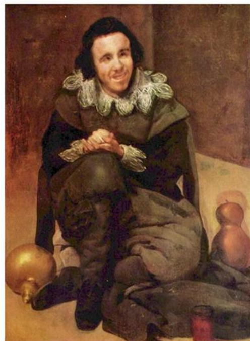
Рисунок 4 - Веласкес Диего.1638. "Карлик дон Жуан Калабаза, называемый Калабазилла. Испания«Дон Хуан Калабасас» (исп. «калабасас» означает «тыква»).

Согласно классификации Д.Данкина существует несколько типов бутылочной тыквы: традиционная бутылка, африканская бутылка, китайская бутылка, индонезийская бутылка, гусиная шея, африканская винная бутылка, миниатюрная бутылка, зукка, японская бутылка, сифон [1].