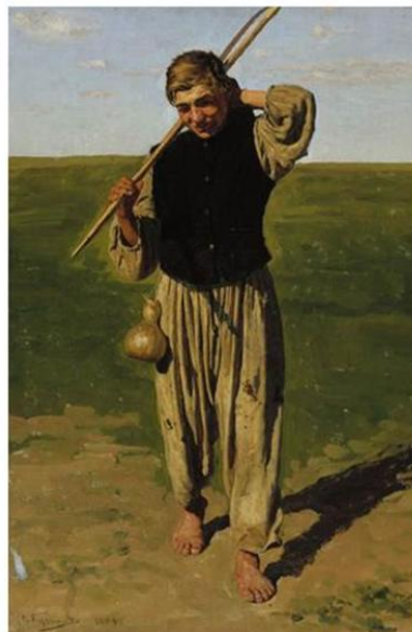
Рисунок 7 - Этюд к картине Н.Кузнецова «На заработки» 1883. Украина.

Далее лагенария распространяется и в другие страны: Россию, Украину, Белоруссию, Молдавию. Как пишет о ней К. Шуман и Э.Гильг (1906): «Упомянем еще о двух экзотических видах тыквенных: о тыкке –горлянке и люффе. Первая из них культивируется в теплых странах земного шара ради ее бутылкообразных плодов с твердой деревянистою кожурой, родиной вида является Ост-Индия. Бутылочным плодам тыквы-горлянки при помощи наложения повязок придается настоящая бутылочная форма, стенки ее настолько тверды и прочны, что очищенные от сердцевины плоды употребляются в качестве бутылок и сосудов» [4].