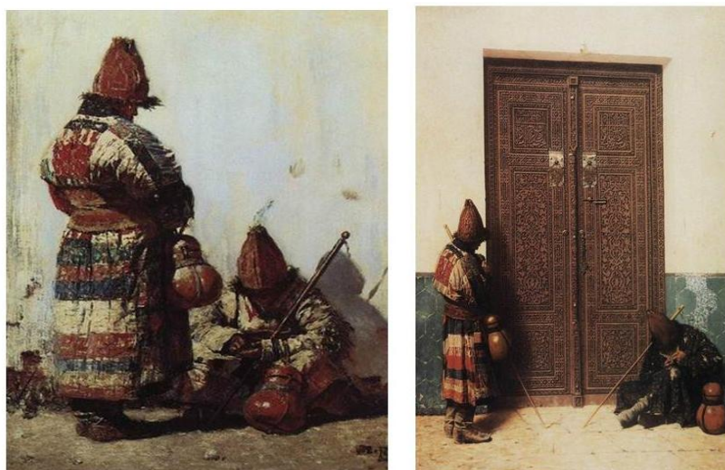
Рисунок 8 –а: В. В. Верещагин (1842-1904). Продавцы посуды в Узбекистане, б - Просители милостыни. У дверей мечети.

Другой вид бутылочной лагенарии, который получил широкое распространение – китайская бутылка. Ее плод характеризуется твердой корой, толщина которой достигает 5-9 мм, объем доходит до 3-3,5 л (рисунки 8,9). На картине В.В.Верещагина как раз отображена китайская бутылка, которая попала в Узбекистан из Китая. С такими пилигримками странствовали дервиши не только по городам Китая, но и всего мира. В Китае лагенария не является важным растением в экономическом отношении, но она растет повсеместно и известна именно как посудная тыква. Широкое ее распространение объясняется минимальными требованиями к агротехнике и хорошими способностями к адаптации в различных экосистемах.