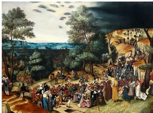
Рисунок 6 - Питер Младший (1564-1638) Брейгель: Путь на Голгофу. Нидерланды.