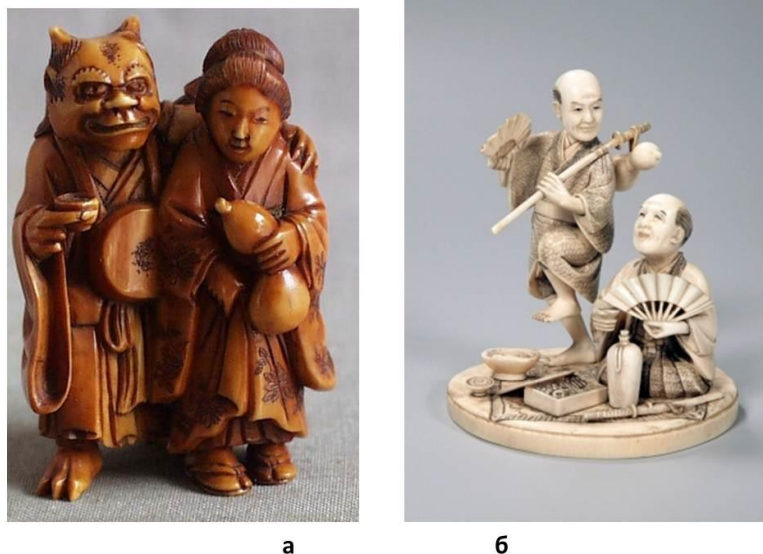
Рисунок 11 –а: Нэцкэ "Гейша и демон", слоновая кость. Высота ок. 4.2 см. Нач. 19в.; б: "Самураи, пьющие sake", слоновая кость, резьба. Япония, период Мэйдзи (1868-1912).

Лагенария, в отличие от других видов тыквенных культур, в высушенном виде обладает на редкость прочной коркой коричневого цвета. Исторически в каждой стране, как контейнер для жидкости, выращивался свой вид лагенарии, что было связано с длиной вегетационного периода, способностью до конца вызревать и формировать прочную корку (рисунок 12). Однако селекция на форму плода не велась [6].