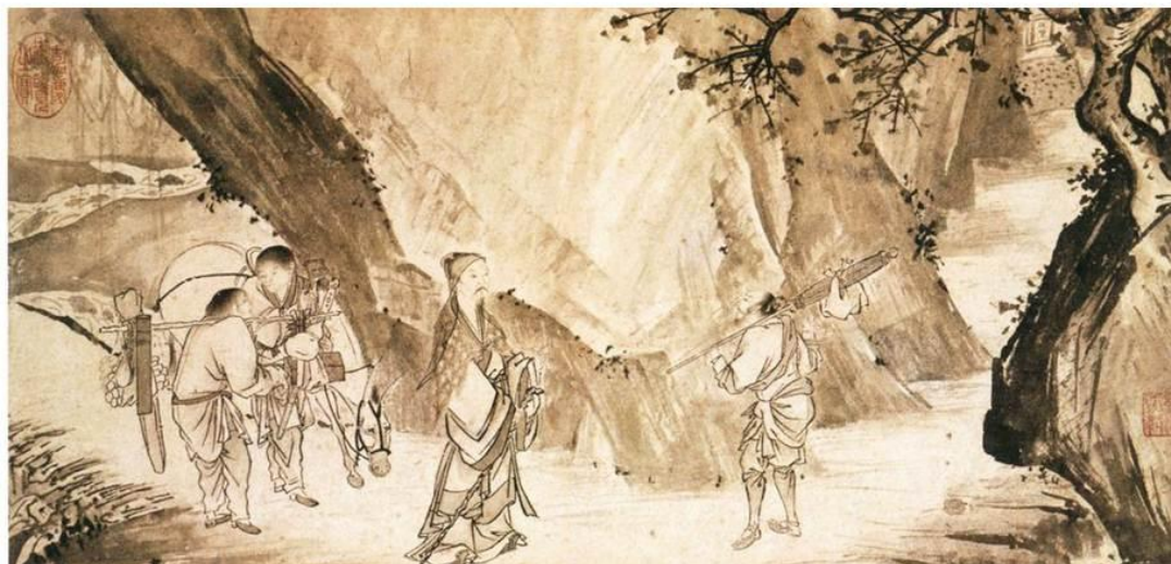
Рисунок 9 - Древняя Китайская живопись, 2312 картин. 18 век. Неизвестный художник.