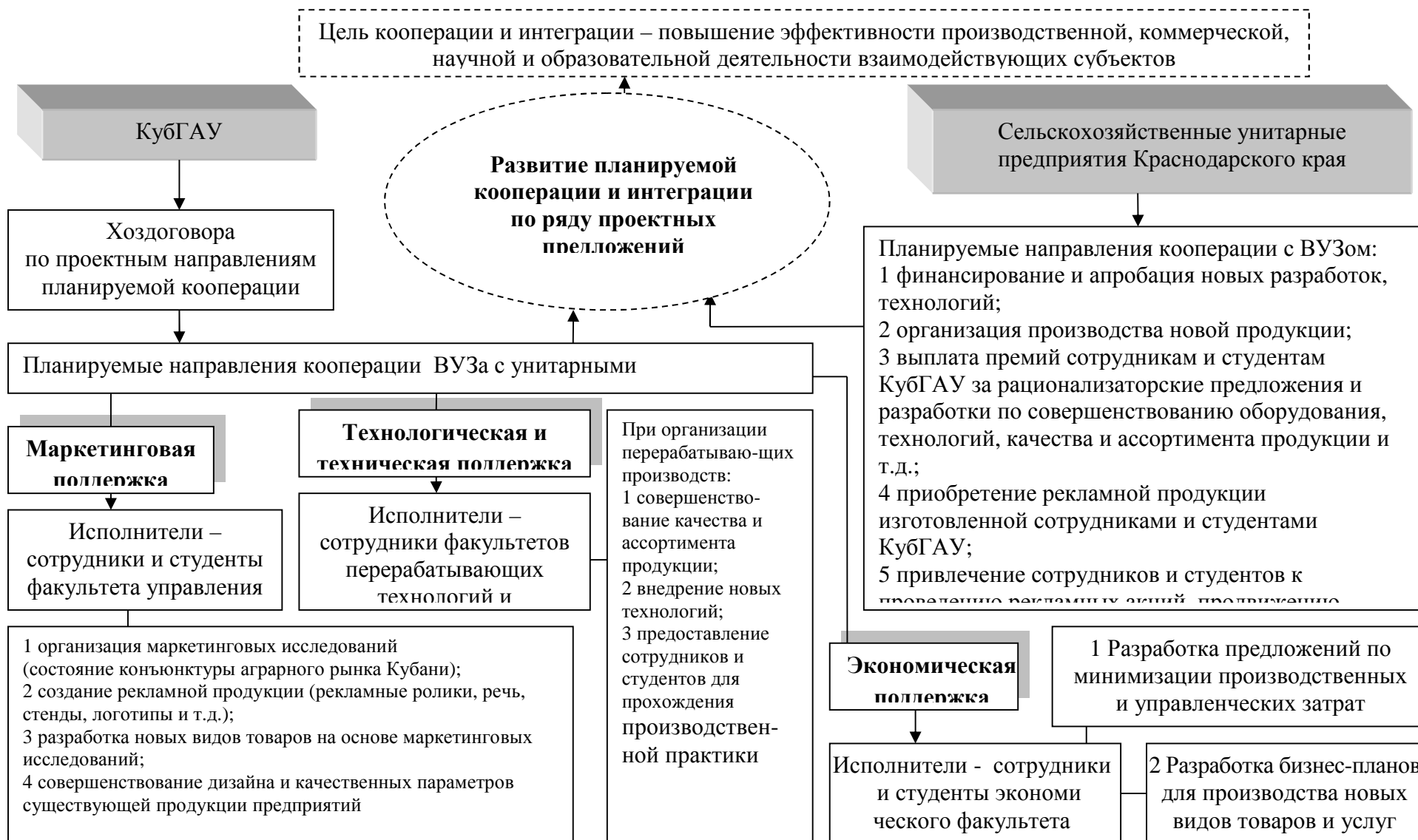
Рисунок 4 – Проектные предложения по развитию кооперации между КубГАУ и сельскохозяйственными унитарными предприятиями