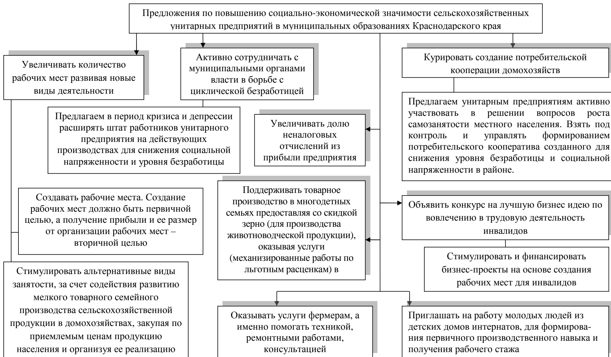
Рисунок 2 – Предложения по повышению социально-экономической значимости унитарных предприятий