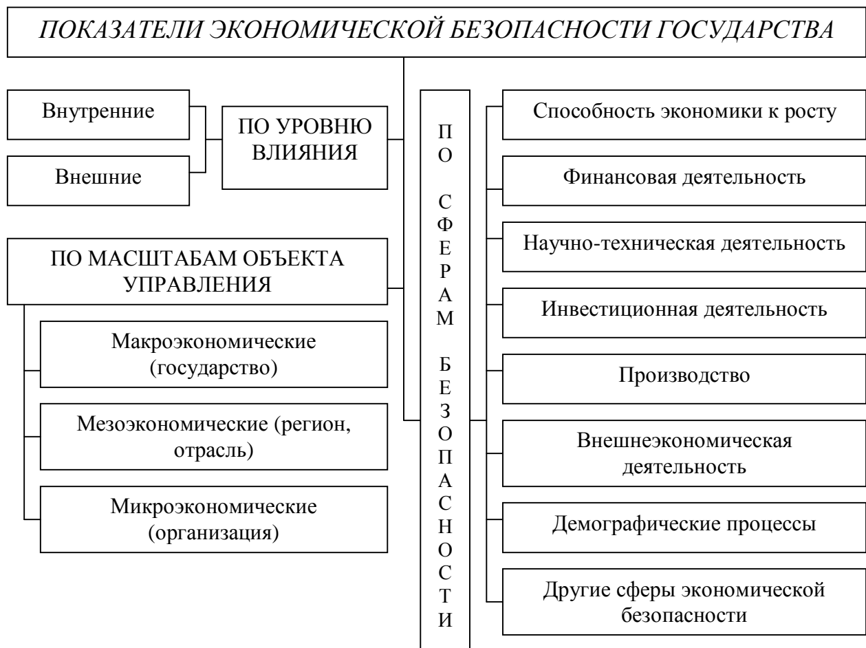
Рисунок 1 – Показатели экономической безопасности государства

Следует отметить, что экономическая безопасность государства изучается на основании широчайшего спектра показателей, относящихся к определенным видам деятельности (рис. 1): финансовой, инвестиционной, научно-технической, внешнеэкономической и т.д.