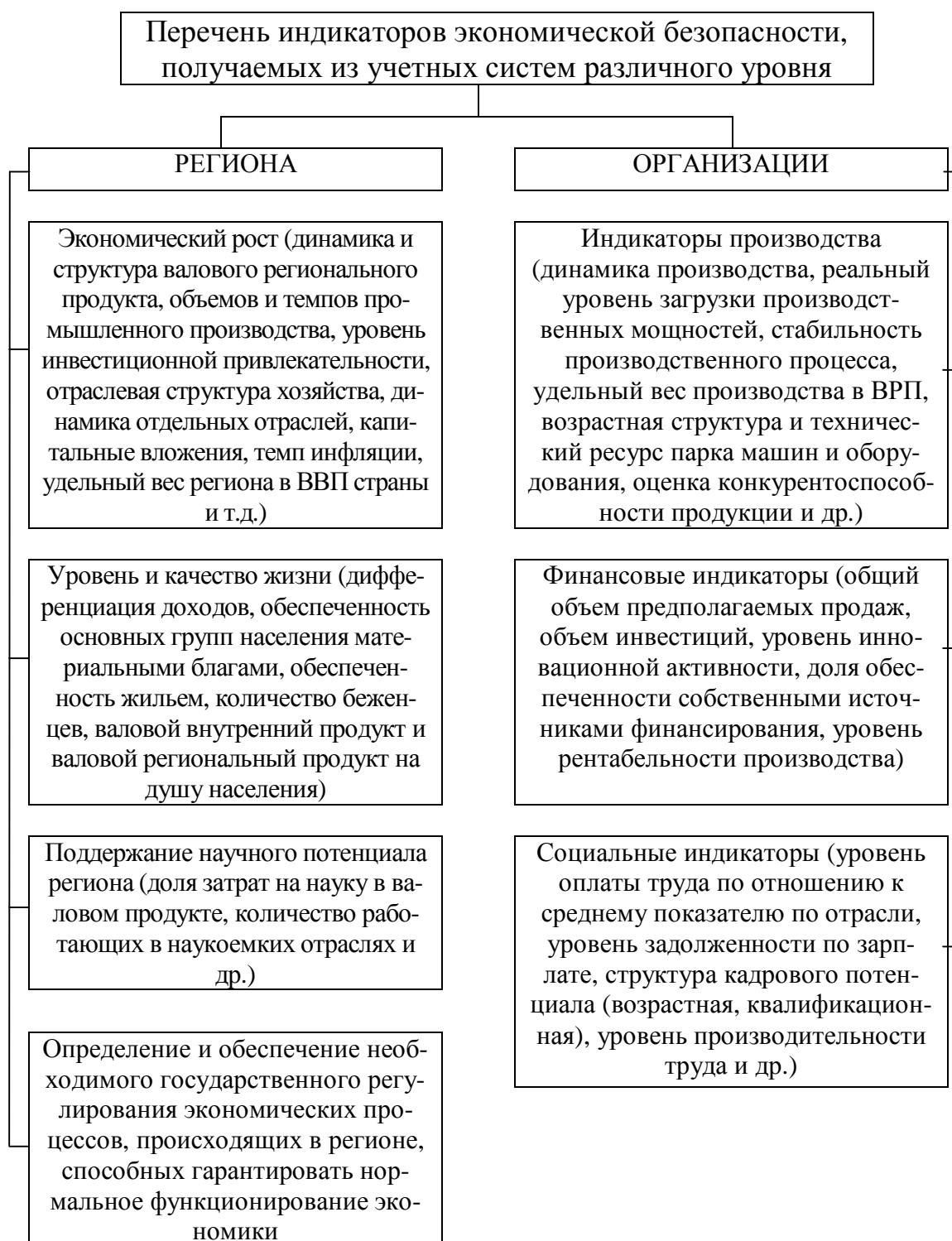
Рисунок 2 – Перечень индикаторов экономической безопасности, получаемых из учетных систем различного уровня