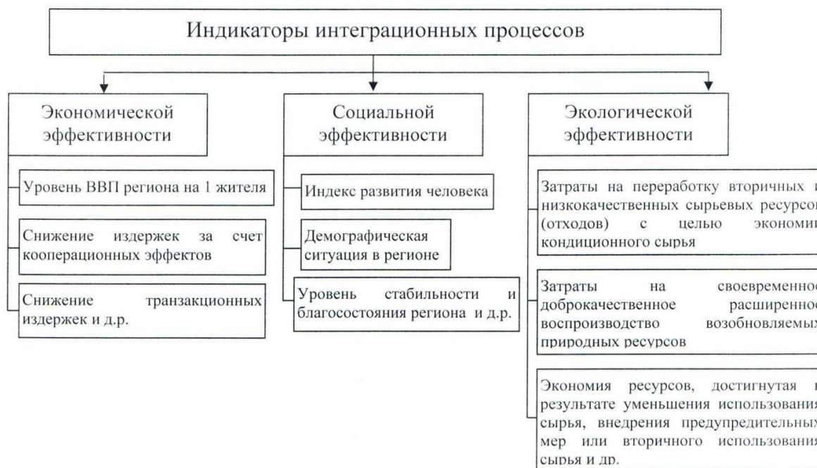
Рисунок 3 – Индикаторы интеграционных процессов проектируемого регионального экономического кластера

Процесс формирования территориально-локализованных производственных систем оказывает непосредственное влияние на интеграцию интеллектуальных, технических, технологических и финансовых ресурсов далеко за пределами самого кластера, содействуя развитию территории, что в целом соответствует стратегическим направлениям социально-экономического развития – повышению уровня и качества жизни населения. Эффективность данного процесса обеспечивается применением системного подхода к выявлению, обобщению и систематизации, а также комплексным учетом ключевых факторов в сопряжении со специфическими условиями и характеристиками конкретной территории. Комплексность и рациональность в стратегическом подходе обеспечивает мощный синергетический эффект, качественно улучшающий инвестиционный климат, обеспечивающий динамичный рост прямых инвестиций, модернизацию экономики, рост доходов бюджетов всех уровней.