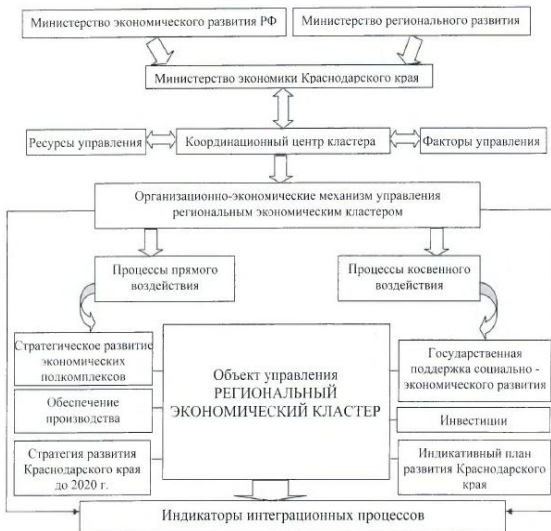
Рисунок 2 - Механизмы функционального взаимодействия проектируемого регионального экономического кластера

Механизмы функционального взаимодействия проектируемого регионального экономического кластера на территории Краснодарского края могут быть представлены следующим образом (рис. 2).