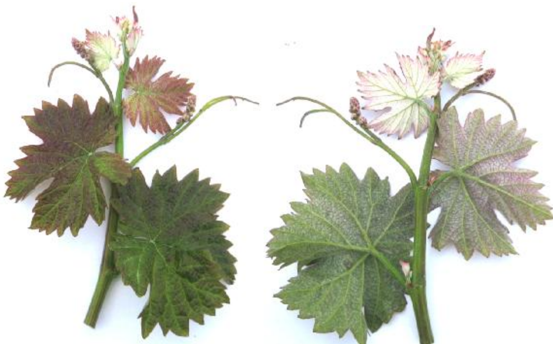
Рисунок 1-2. Верхушка молодого побега сорта винограда «Профессор Давидис»

014 - интенсивность (плотность) паутинистого опушения на междоузлиях: 3 – редкое (слабое);