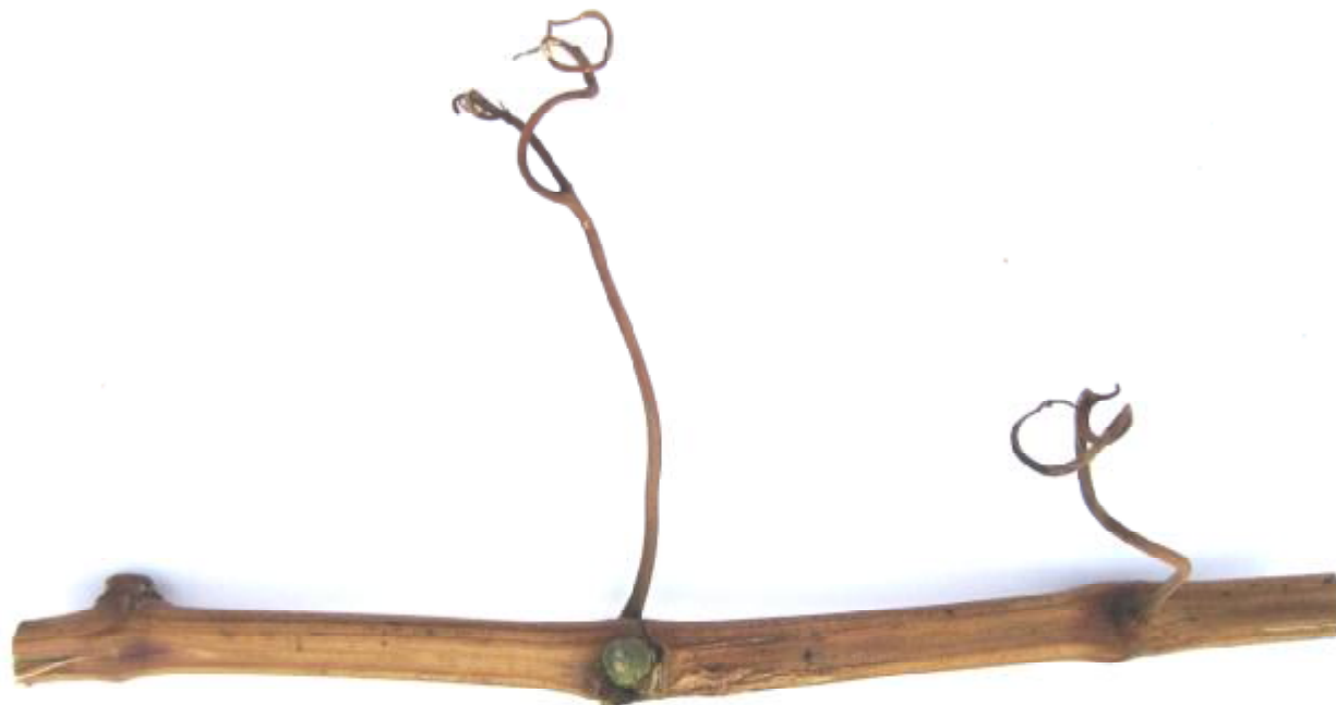
Рисунок 9-10. Одревесневший побег и распустившийся глазок сорта винограда «Профессор Давидис»