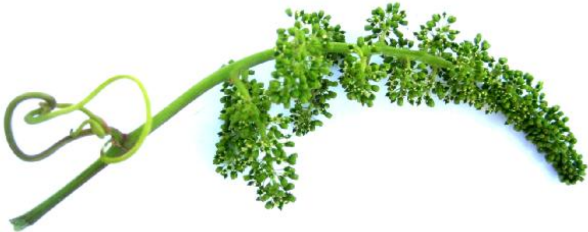
Рисунок 5. Соцветие сорта винограда «Профессор Давидис»