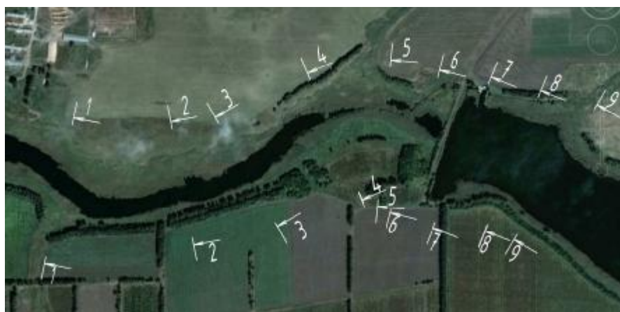
Рисунок 1. Пример разбивки поперечных профилей

Необходимо разработать поперечные профили, на которых представлены поперечные сечения с исправленной линией дна до исторических отметок. В морфологическом отношении форма русла была принята в виде трапецеидального сечения, глубины по профилю приняты постоянными. Формы береговой линии восстанавливаются до естественного состояния, это уменьшит влияние поверхностного стока с прилегающих территорий на водный объект (рис. 1–2).