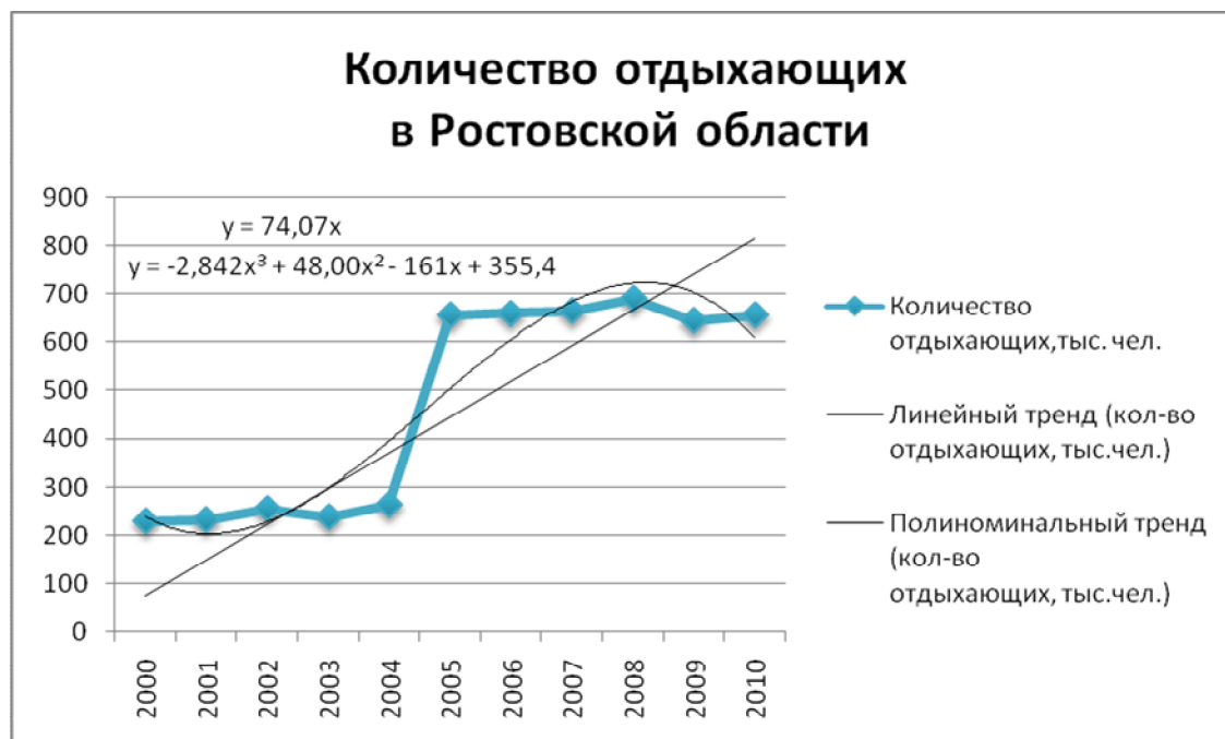
Рис. 3. Количество отдыхающих в Ростовской области

Растет количество отдыхающих и в Ростовской области, но значения этого показателя измеряется не в миллионах, а в тысячах человек. На рисунке 3 показана динамика количества отдыхающих в Ростовской области в 2000-2010 гг.