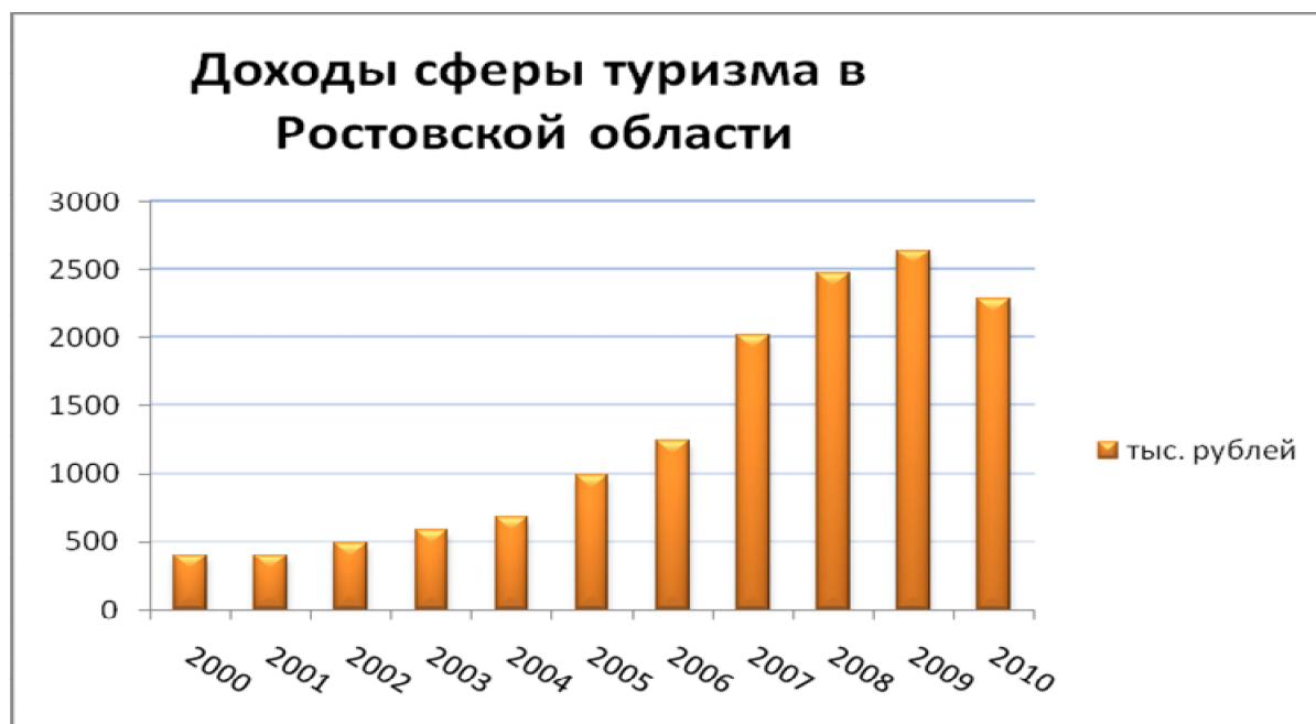
Рис. 4. Доходы сферы туризма в Ростовской области

Выгодное географическое положение, благоприятные климатические условия, развитая транспортная инфраструктура, богатое историческое и культурное наследие, высокоразвитые промышленный и аграрный сектора региональной экономики создают предпосылки для развития туристического комплекса Ростовской области.