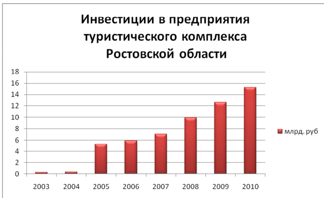
Рис. 5. Инвестиции в предприятия туристического комплекса Ростовской области (по материалам сайта http://www.rostov.gks.ru )