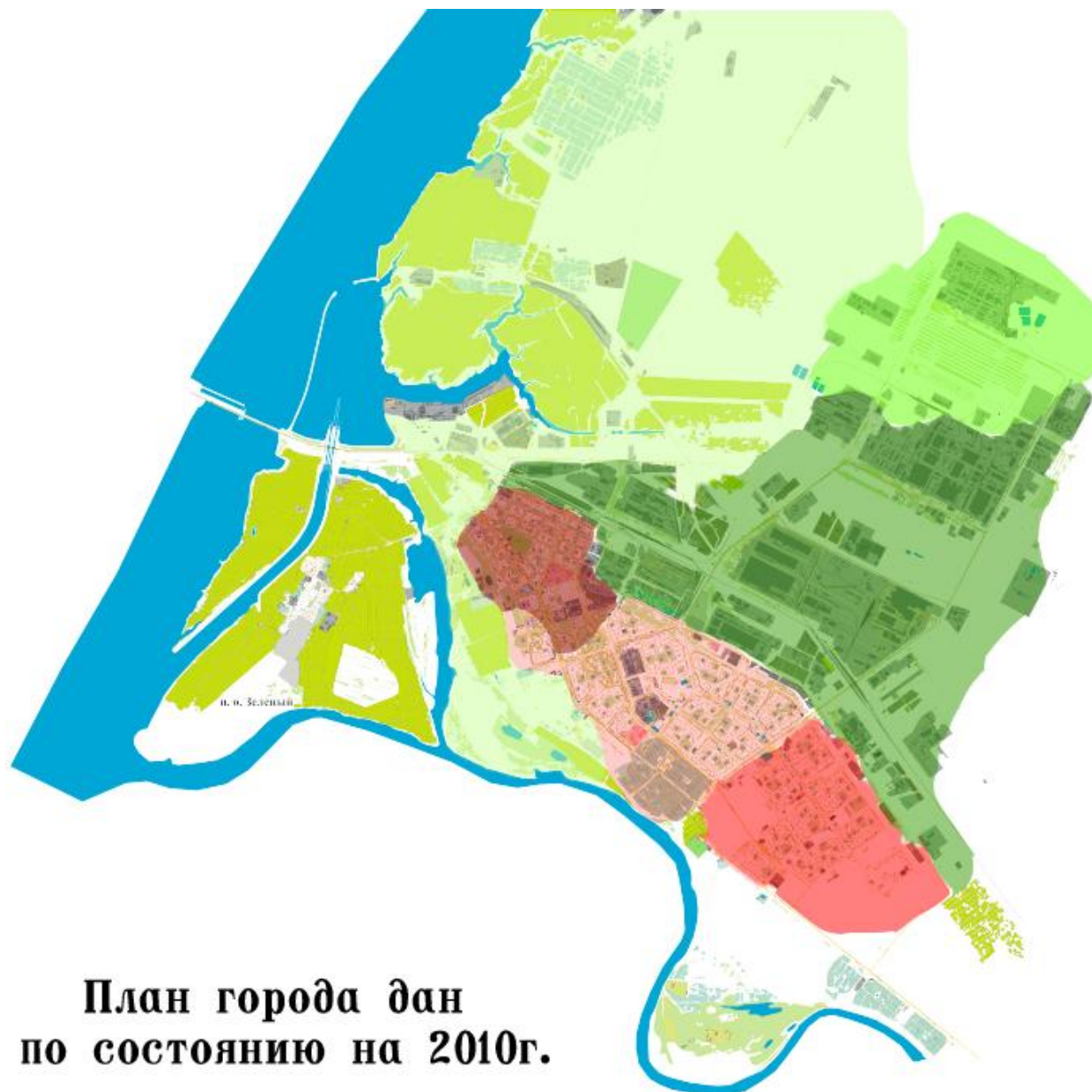
Рис. 3. Картограмма проведения мероприятий по созданию единой системы озеленения г. Волжского.

Насаждения общего и ограниченного пользования