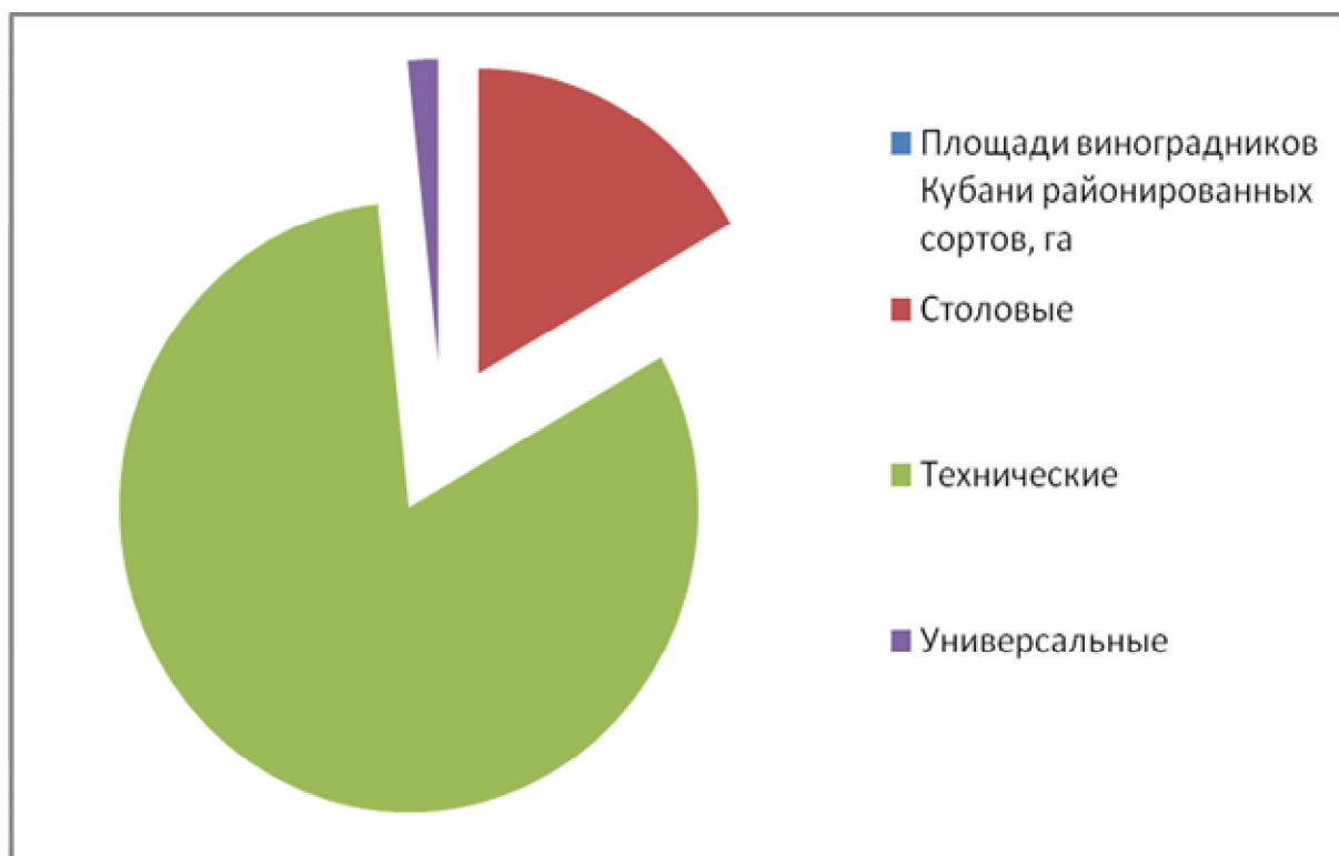
Рис. 2. Соотношение площадей виноградников Краснодарского края под рекомендуемыми сортами трех направлений использования.

В Краснодарском крае из общей площади 27060 га (на 01.01.2009 г.) под районированными сортами занято 83,8% (рис. 3).