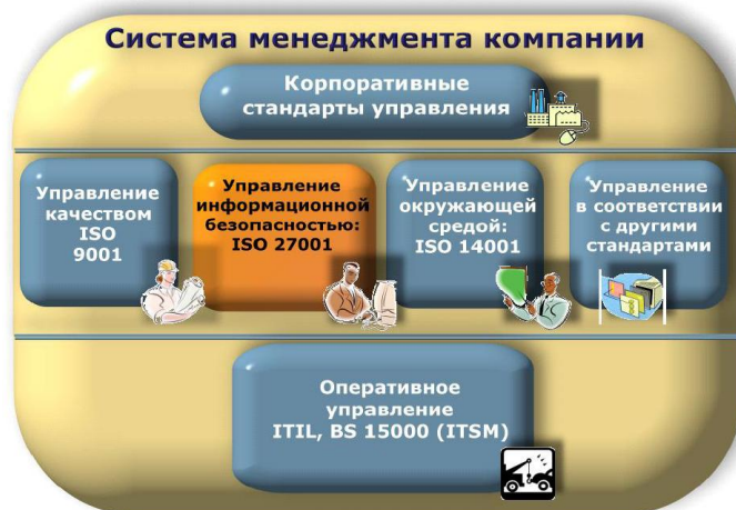
Рисунок 1 - Место СМИБ в общей системе менеджмента организации

Немаловажным фактором при этом, является и тот, что построенные на его основе ISO 27001 СМИБ органически вписываются в общую систему менеджмента организации, имеющую единые базовые понятия, процессный подход и структуру (рис. 1).