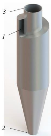
Рисунок 1 – 3D модель объекта исследования: 1 – входной патрубок; 2 – бункер; 3 – выходной патрубок

Также особое внимание уделялось расчету зависимости эрозионного износа от углового распределения скорости частиц при их столкновении со стенками. Это позволило более точно оценить влияние различных эксплуатационных параметров на характер износа и выделить наиболее критические зоны, подверженные абразивным нагрузкам.