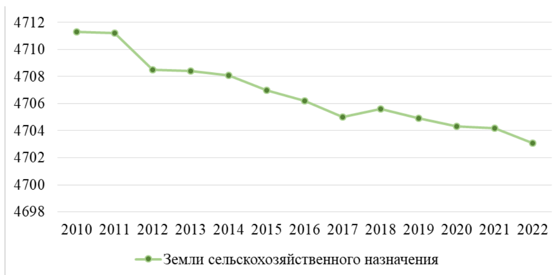
Рисунок 4 – Изменение площади земель сельскохозяйственного назначения в Краснодарском крае, тыс. га

В перспективе можно рассмотреть возможность использования НСПД для решения проблем сельскохозяйственных земель: сокращения количества невостребованных земельных долей, создания условий для уменьшения нарушений земельного законодательства в части использования участков не по назначению, увеличения эффективности их использования на экологически безопасном уровне.