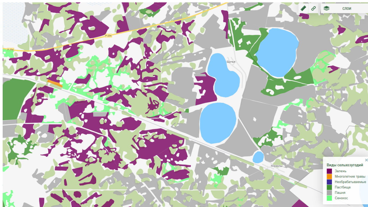
Рисунок 2 – Применение информационной системы «Геопортал Курганской области»

определить границы угодий с учетом привязки к различным на картографической основе природным и искусственным объектам.