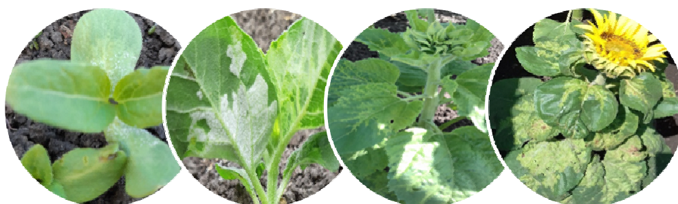
а б в г Рисунок 2 – Симптомы ЛМР на подсолнечнике:

а – фаза 1 пара настоящих листьев, б – фаза 3 пара настоящих листьев, в – фаза бутонизации, д – фаза цветения.