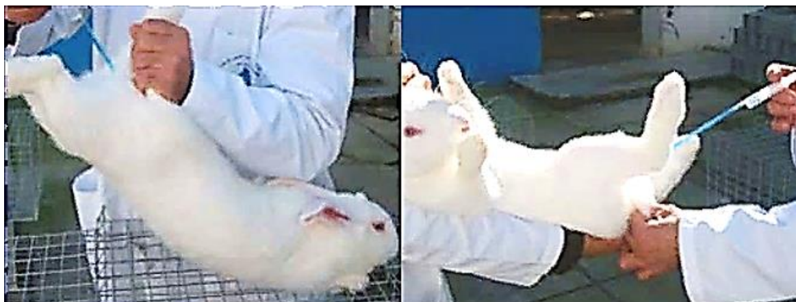
Рисунок 4 – Искусственное осеменение крольчих

Первым фактором, который следует учитывать при размножении кроликов, является возраст первого спаривания. Если непродуктивный период до первого помета сократить, то продуктивность кроликов, как правило, повышается. Исследования, проведенные на кроликах, получавших сбалансированный концентрированный корм, показали, что самки, впервые спаренные в 5,5 месяцев, проявили затем более низкую продуктивность за год, чем самки, оплодотворенные на 3 недели раньше. Следовательно, при оптимальных условиях кормления и содержания молодых самок можно начинать спаривать, если они достигли живой массы в 80–85 % массы взрослых. На мелких фермах предпочтение отдается естественному спариванию, в то время как на крупных – обычно используется искусственное осеменение (ИО), которое практикуется в кролиководстве с конца 70-х–начала 80-х гг. прошлого века. ИО обычно производится как свежей разбавленной спермой в течение 6–12 ч после получения, так и охлажденная сперма, хранящаяся до 36 ч [6, 15] (рис. 4).