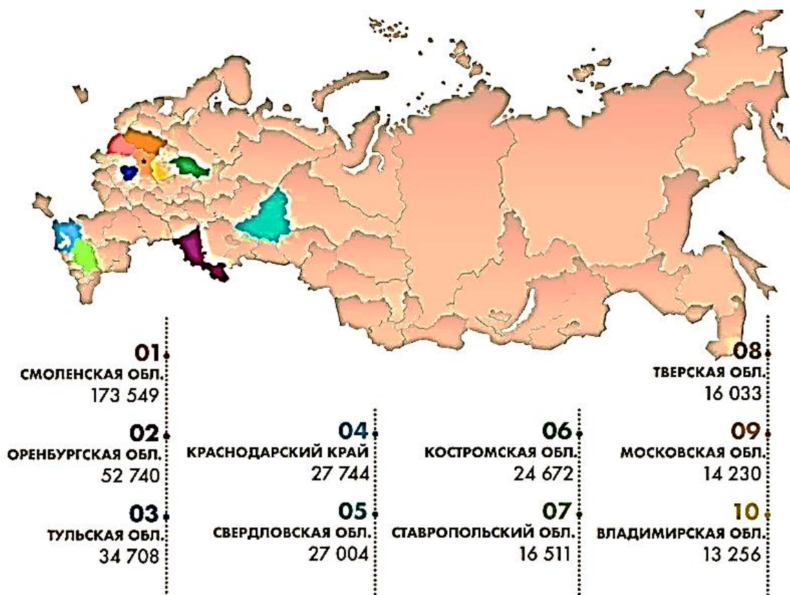
Рисунок 3 – Численность поголовья кроликов в ряде регионов РФ

Во-вторых, несмотря на то, что производство крольчатины в нашей стране в целом проявляет тенденцию роста, ситуация с ее потреблением и объемами рынка не столь однозначна. Например, если в 2006–2008 гг. потребление крольчатины в России сократилось в 1,8 раза (с 4 712 до 2 556 т), то в 2009 г. оно выросло до 5 012 т, а в 2010 г. вновь сократилось до 2 870 т. Почти \frac{2}{3} произведенного объема крольчатины приходится на хозяйства Уральского ФО, которые увеличили объемы реализации продукции в 1,4 раза. Второе место занимает Северо-Западный ФО, а третье – Центральный ФО (рис. 3).