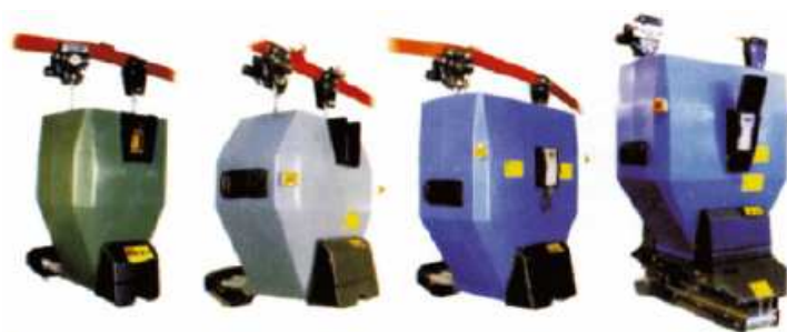
Рисунок 3 – Подвесные бункерные роботы для раздачи комбикормов Pellon

Фирма «Pellonraja OY» (Финляндия) разработала серию подвесных бункерных роботов для раздачи комбикормов (рисунок 3), которые предназначены для использования на фермах с раздельным типом кормления: грубые и концентрированные корма.