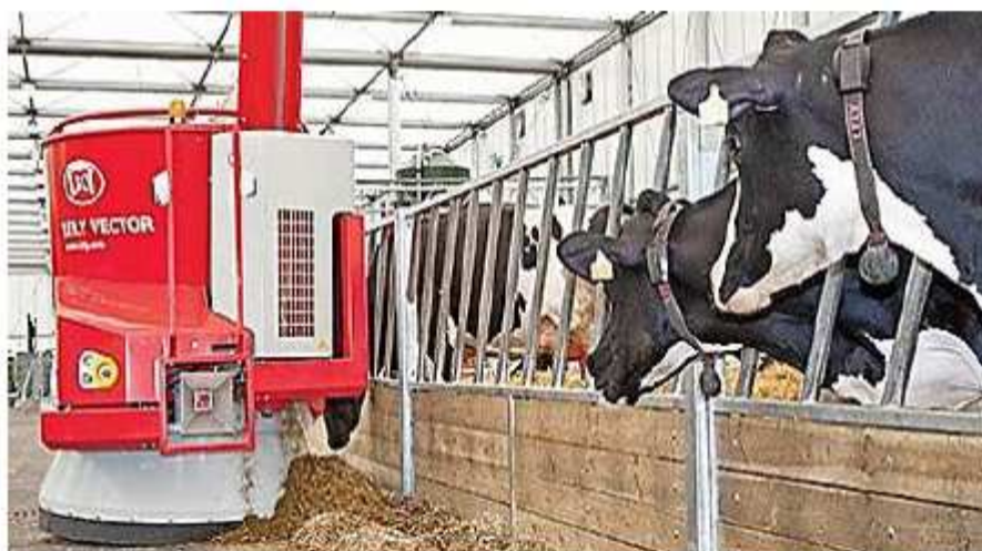
Рисунок 1 – Робот раздатчик кормов на молочных фермах

В настоящее время комплексная автоматизация процессов на молочных фермах решается путем применения робототехники: роботов-раздатчиков кормов (рисунок 1), роботов, поддвигающих корма [4].