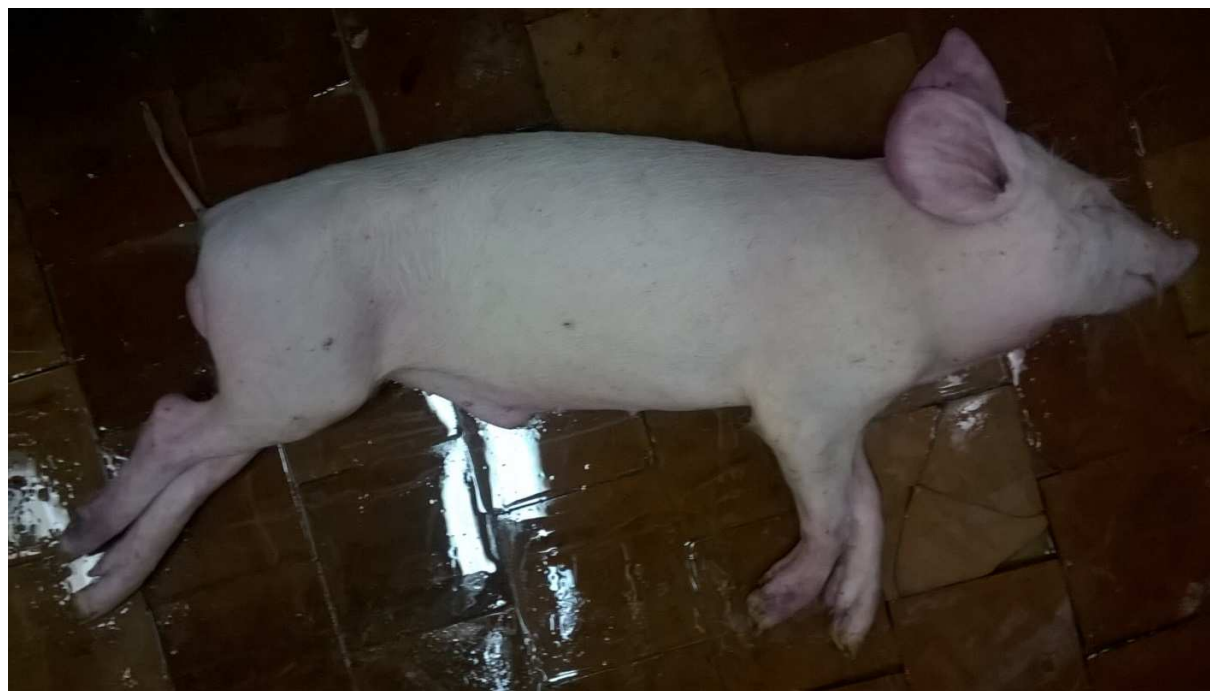
Рисунок 1. Слабовыраженный цианоз кожных покровов у подсвинка, павшего на 7 сутки после внутримышечного инфицирования изолятом Рязань-Сапожково.

Внешний вид и картина патологоанатомического вскрытия павших от АЧС подсвинков приведены на рисунках 1-4.