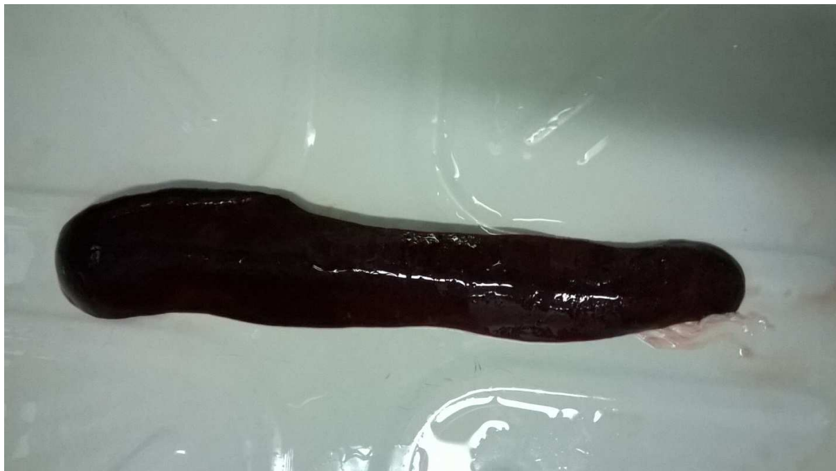
Рисунок 2. Селезенка павшего подсвинка на 8 сутки после внутримышечного инфицирования изолятом Коломна-Песково (размер селезенки увеличен в 1,5-1,6 раза).