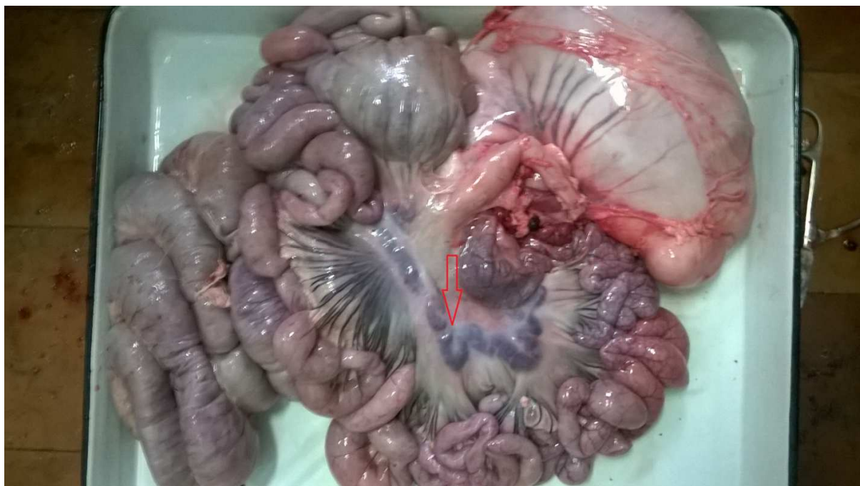
Рисунок 4. Геморрагический лимфаденит мезентеральных лимфатических узлов у павшего подсвинка на 17 сутки при алиментарном заражении изолятом Псков-Яшково.