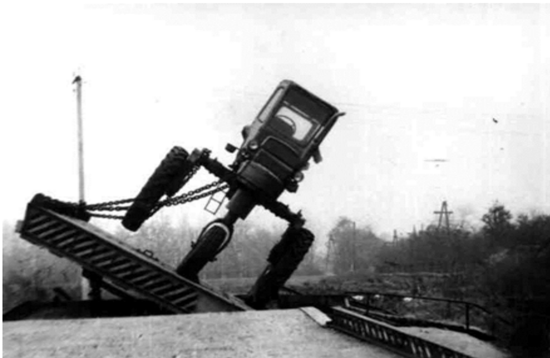
Рисунок 3 - Определение поперечной устойчивости высококлиренсного трактора для обработки высокостебельных культур

Трактор для уборки высокостебельных культур МТЗ-80П (рис.4) содержит заводящее устройство, включающее конусные катушечные барабаны 1, установленные на подшипниках 2, ось барабанов жестко соединена с телескопическими кронштейнами 3, установленными на брус 4. Брус 4 с помощью кронштейна 5 присоединяется к передней балке трактора [5, 6]. Такое устройство позволяет установить конусные барабаны на заданную высоту и длину относительно пригибающих криволинейных деформаторов 7, что обеспечивает плавный наклон растений. Деформаторы 7 установлены под брусом переднего моста трактора на кронштейнах 12. Под трактором установлены сужающие задние пригибающие деформаторы 10.