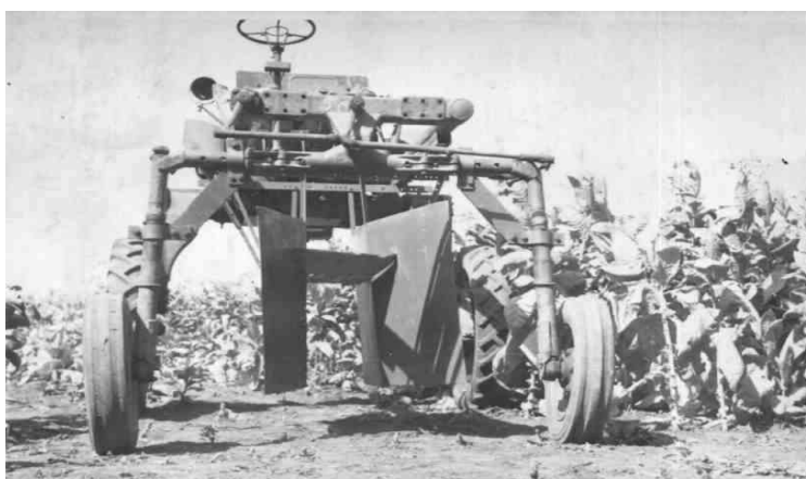
Рисунок 2 - Лабораторно-полевая установка для поперечной и продольной деформации растений табака.

Изучали и поперечный изгиб табачных растений (рис.2.)