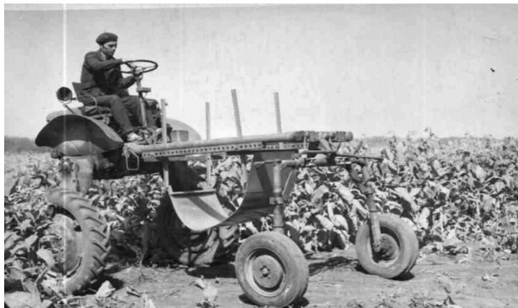
Рисунок 1 - Лабораторно-полевая установка для изучения деформации растения табака по высоте (продольный изгиб).

Изучение проводили с помощью деформаторов, изготовленных из листовой стали и навешенных на лабораторную установку с регулируемым агротехническим просветом от 400 до 1200 мм.