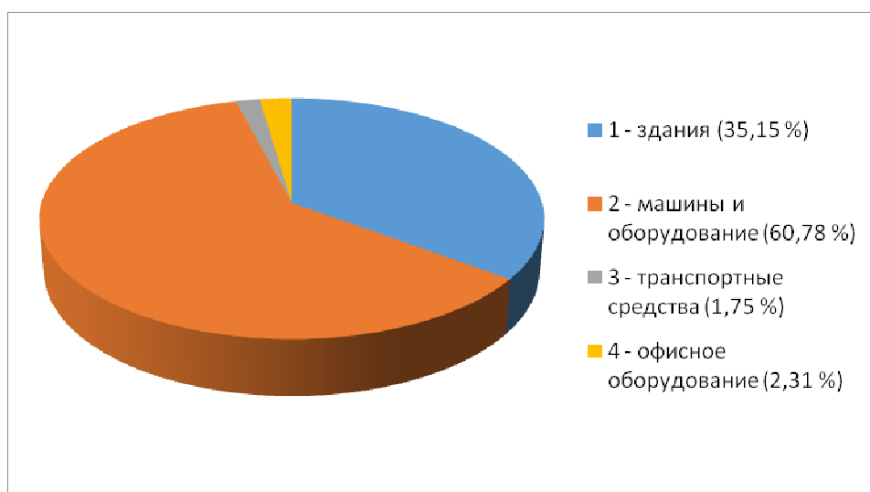
Рисунок 2 - Структура основных средств на конец года в филиале ОАО ВО «Технопромэкспорт» в г. Севастополе за 2014-2015 гг., %

Показатели, характеризующие состояние и движение основных средств в филиале ОАО ВО «Технопромэкспорт» в представлении в таблице 6.