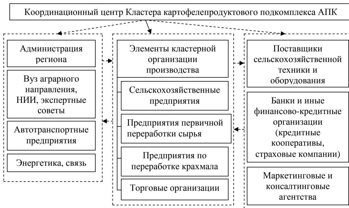
Рисунок 4 – Схема кластеризации на примере картофелепродуктового подкомплекса АПК

На рисунке 4 представлена типовая кластеризация при организации производства на примере картофелепродуктового подкомплекса АПК.