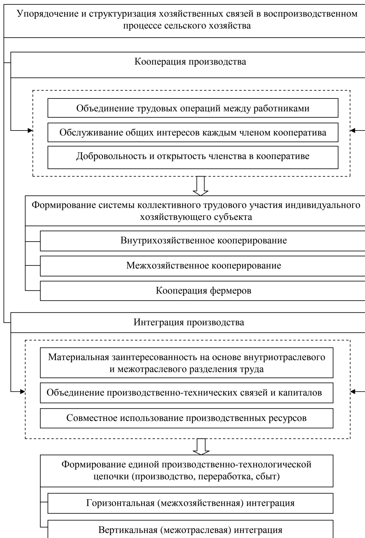
Рисунок 5 – Разграничительная основа процессов кооперации и агропромышленной интеграции