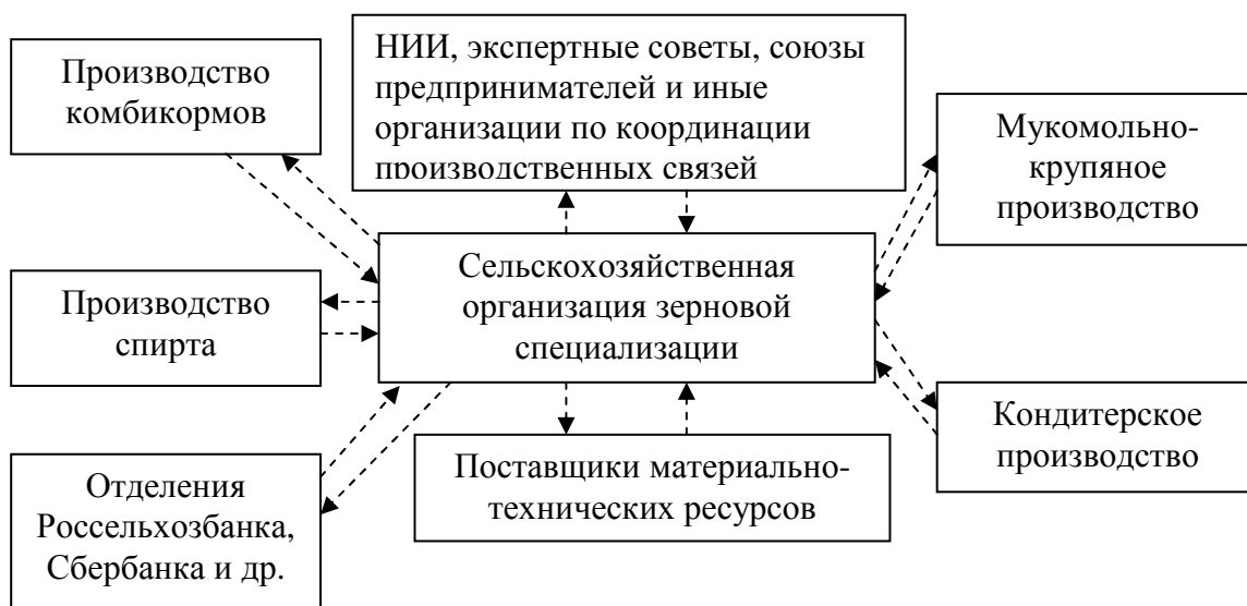
Рисунок 2 – Схема кластеризации в зернопродуктовом подкомплексе АПК

Кластеризация производства на основе зернопродуктового подкомплекса должна иметь необходимые предпосылки для формирования устойчивых межхозяйственных связей материально-финансовых потоков. Для этих целей необходимо оптимизировать поставки сырья и готовой продукции, сформировать систему открытого либо дистанционного взаимодействия с научно-исследовательскими учреждениями и общественными организациями, обеспечить нормативно-правовое регулирование и координацию деятельности между элементами кластера и его взаимоотношениях с другими участниками рыночной системы.