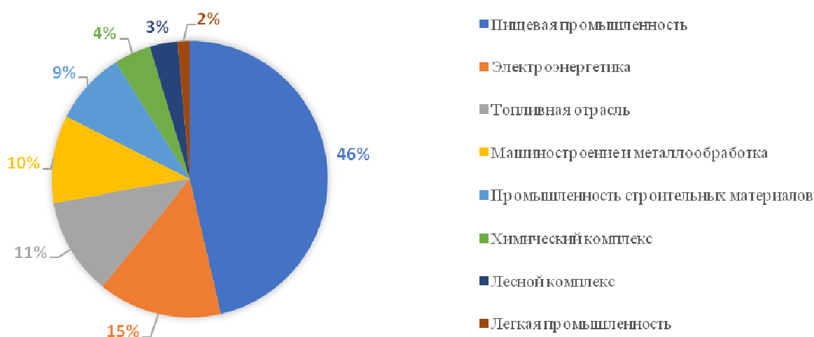
Рисунок 1 - Структура промышленности Краснодарского края [5]

В пищевой промышленности Краснодарского края функционируют более 2200 предприятий, из них 200 относятся к категории крупных и средних. В отрасли производится более 2500 наименований продуктов питания, из которых свыше 40 % - перспективные разработки, соответствующие европейским стандартам качества.