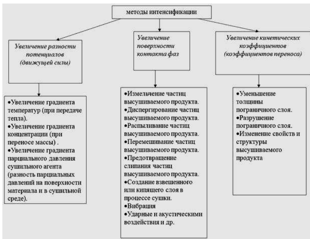
Рисунок 1 – Методы интенсификации сушки зерна

Из этих уравнений вытекают следующие методы интенсификации (рисунок 1):