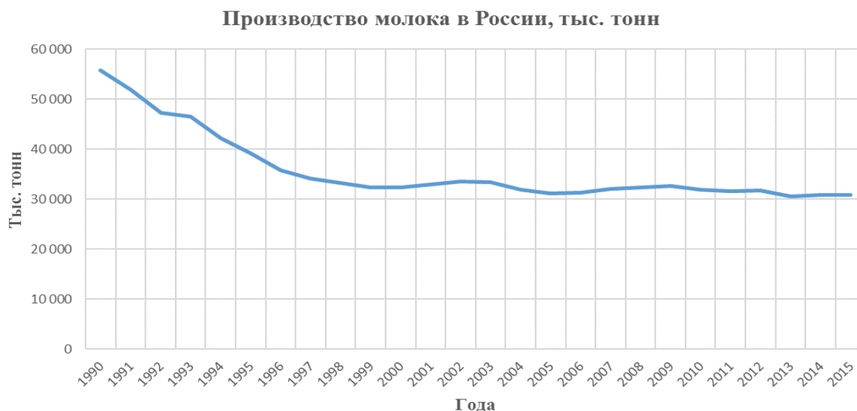
Рисунок 1 – Динамика производства молока в России, тыс. т

доходы формируют платежеспособный спрос) также оказывают влияние на потребительское поведение. Девальвация национальной валюты в 2015 году и снижение покупательной способности денежных доходов населения способствовали ощутимому сокращению спроса на молочную продукцию: среднедушевое потребление в 2015 году снизилось на 3,7%, совокупное – на 4,4%.