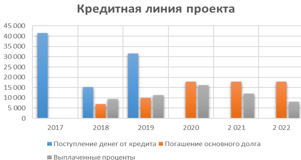
Рисунок 3 – Кредитная линия проекта, тыс. руб.

В расчетах учитывается последовательный выход на проектную мощность в соответствии с планом реализации. Исходя из номинального объема производства, а также сезонных колебаний и технологических простоев, представлен план производства на весь период планирования. План реализации продукции представлен в таблице 2. Расчеты выполнены по состоянию на 20 декабря 2016 г.