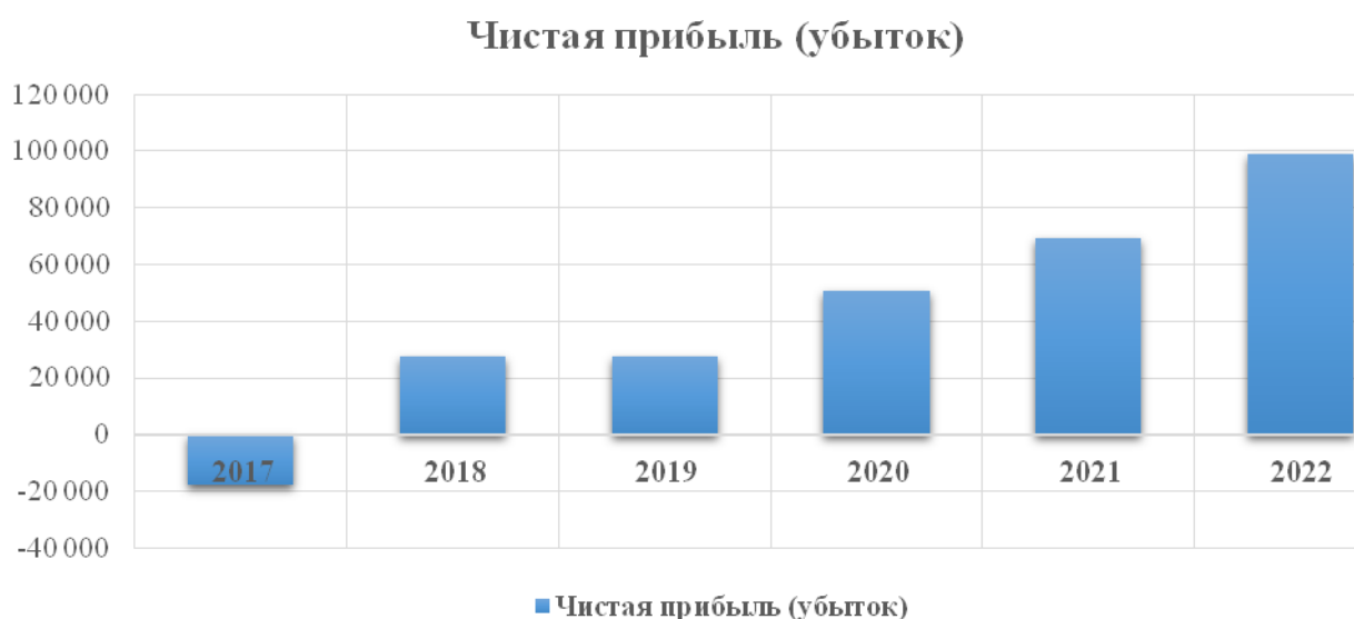
Рисунок 4 – Чистая прибыль по проекту, тыс. руб.