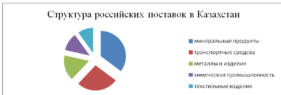
Рисунок 2 – Структура импортных потоков

В структуре российских поставок в Казахстан (по данным ФТС России, в 2013 г.) основную долю составляли минеральные продукты – 31,9%, машины, оборудование, транспортные средства, приборы и аппараты – 24,3%, металлы и изделия из них – 14,9%, продукция химической и связанных с ней отраслей промышленности – 10,5%, продукты животного и растительного происхождения, продовольственные товары – 9,0% (рисунок 2).