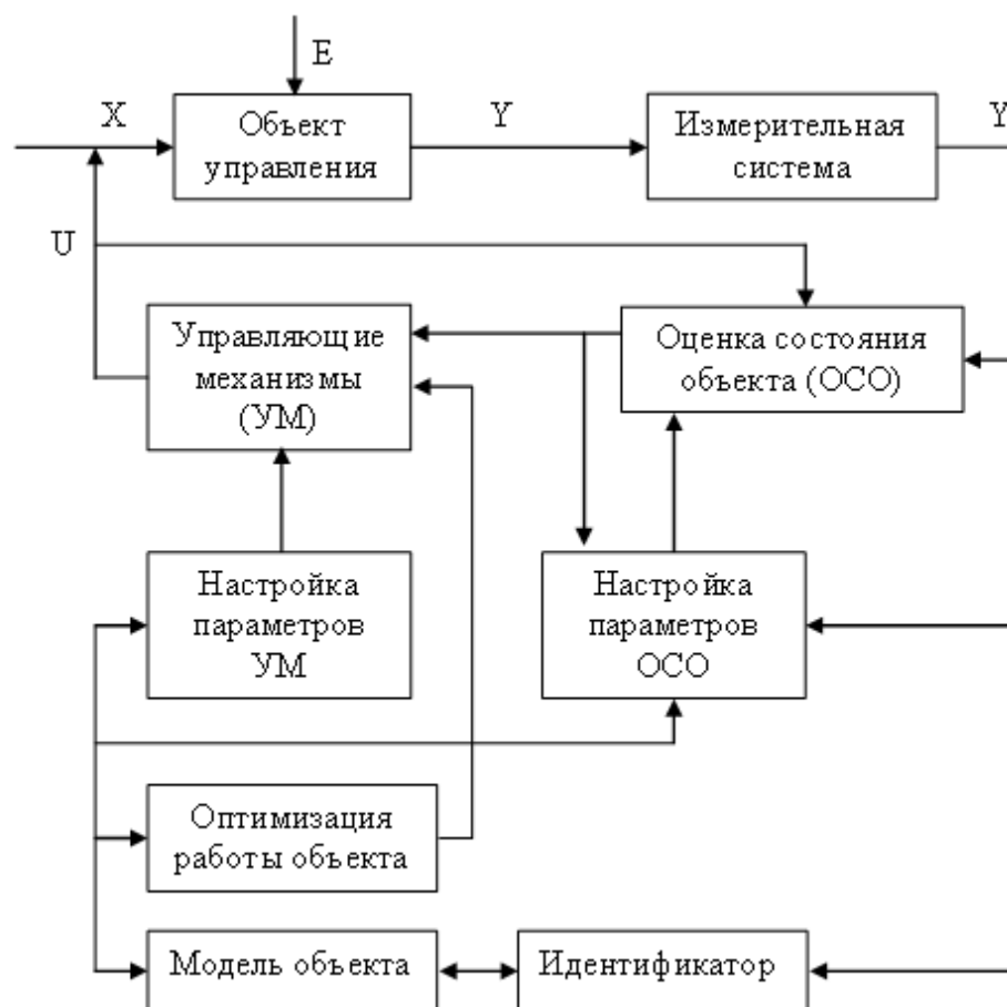
Рисунок 1. Традиционная система управления

Отметим что, современное телекоммуникационное оборудование генерирует множество статистической информации о своем состоянии. При этом администратор сети, даже очень опытный, не в силах отслеживать состояние всех устройств в ВС. Именно поэтому большая часть работы по сбору и анализу технологической информации о функционировании сети должна проводиться системой управления, а администратору должна выводиться только обработанная информация. В настоящее время существует несколько современных информационных технологий, позволяющих создавать интеллектуальные СУ: экспертные системы, искусственные нейронные сети, нечеткая логика, генетические алгоритмы и др.