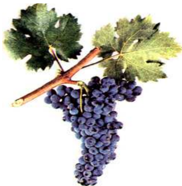
Рис. 2. Виноград сорта Плечистик

черным, выступающим в качестве опылителя: из их ассамбляжа и готовится знаменитое цимлянское игристое вино.