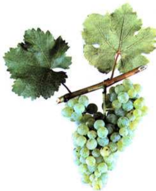
Рис. 3. Виноград сорта Сибирьковый

Бессергеновский № 10 (рис. 4) был обнаружен на старых виноградниках станицы Бессергеновская Ростовской области. Бессергеновский - поздний технический сорт винограда, пригодный для приготовления белых столовых вин. Сахаристость ягод в среднем за годы изучения 18,9 г/100 см 3 , кислотность 9,1 г/дм 3 .