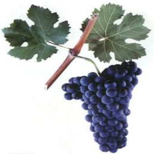
Рис. 1. Виноград сорта Варюшкин

Варюшкин (рис. 1) – старинный донской технический сорт винограда средне-позднего периода созревания. Относится к эколого-географической группе сортов бассейна Черного моря, ныне возделывающийся на Лону и в Дагестане. Цветок обоеполый. Грозди средней величины, конические, крылатые, средней плотности. Ягоды средние, округлые, черные, с густым восковым налетом. Кожица толстая. Мякоть сочная. Вкус гармоничный. Это северный сорт повышенной зимостойкости, с интенсивной концентрацией сахаров, малотребовательный к теплу, относительно устойчивый к заболеваниям.