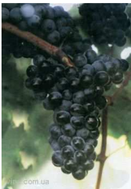
Рис. 6. Виноград сорта Красностоп анапский

Красностоп анапский (контроль для красных изучаемых сортов винограда) – винный сорт винограда, отобранный И.И Зоткиным в результате клоновой селекции донского аборигена Красностоп золотовский, позднего срока созревания (рис.6).