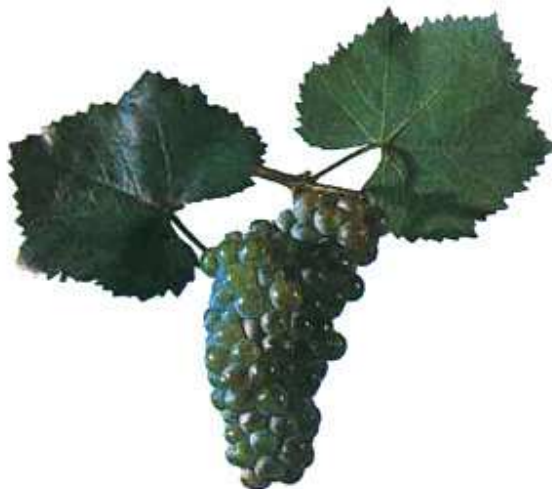
Рис. 5. Виноград сорта Алиготе

Алиготе (контроль для белых изучаемых сортов винограда) - французский винный сорт винограда народной селекции (рис. 5). Он относится к эколого-географической группе западно-европейских сортов винограда.