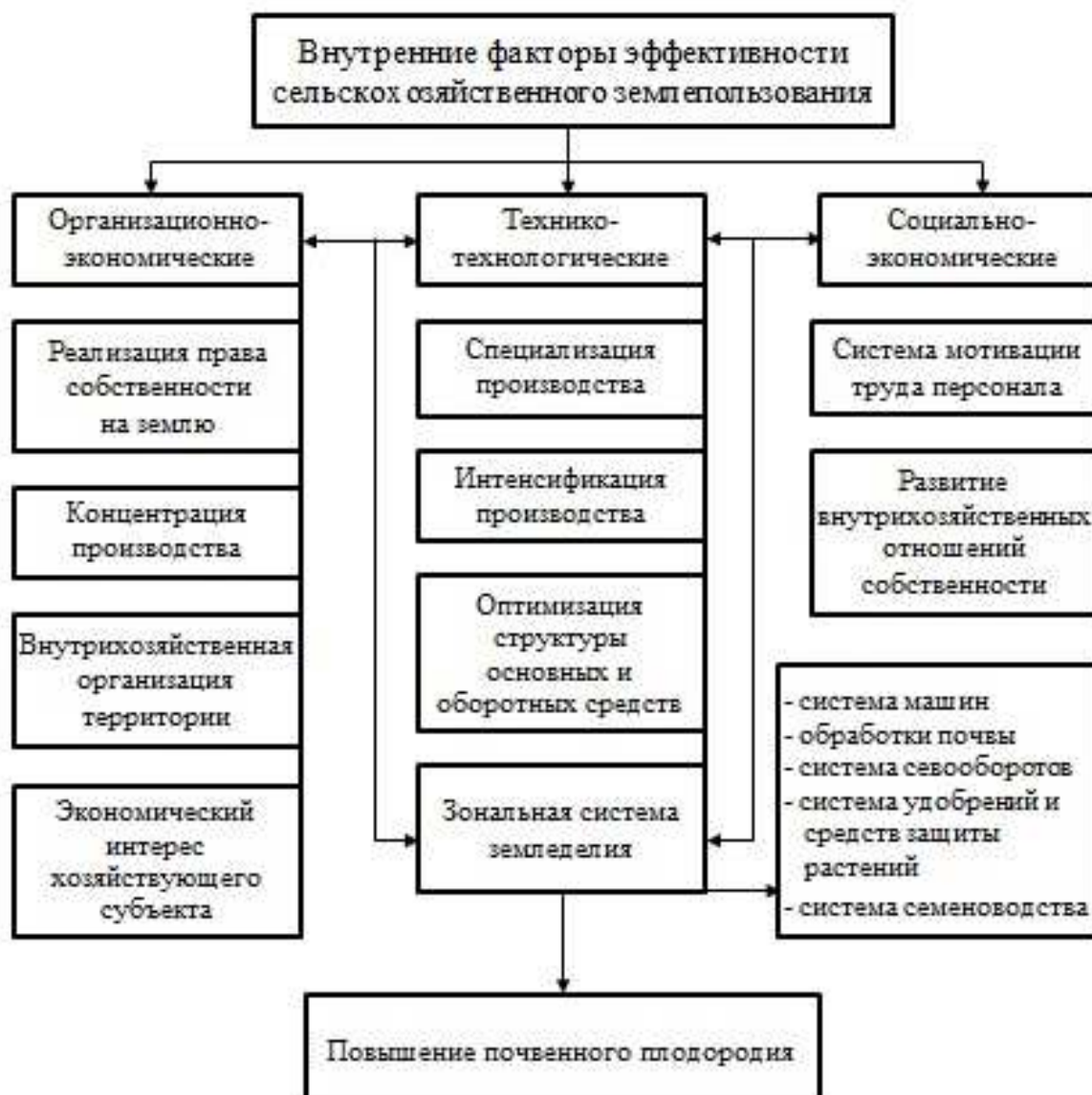
Рисунок 1. Внутренние факторы экономической эффективности использования земель сельскохозяйственного назначения

В группе организационно-экономических факторов основными являются реализация права собственности на землю, экономический интерес хозяйствующего субъекта, концентрация производства и внутрихозяйственная организация территории.