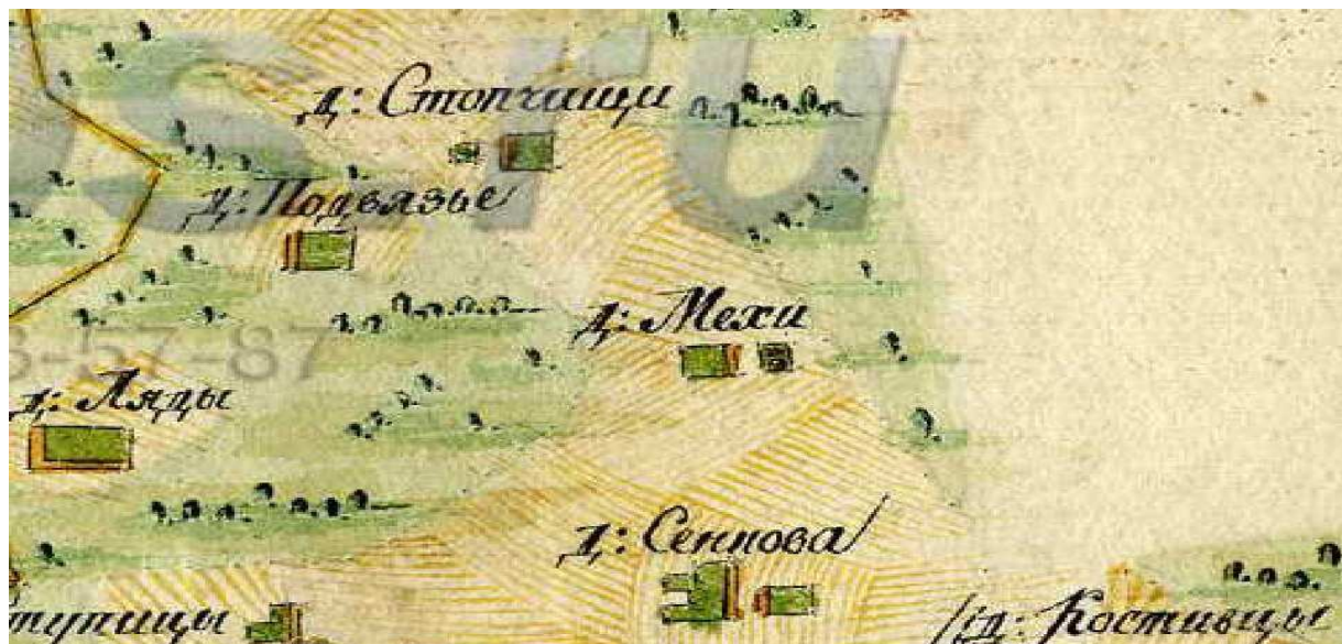
Рисунок 4 – Пример схемы проведенного межевания дач

Генеральным Межеванием было охвачено 35 губерний, в которые входило 188,3 тысячи владений, составивших 300,8 миллионов гектар.