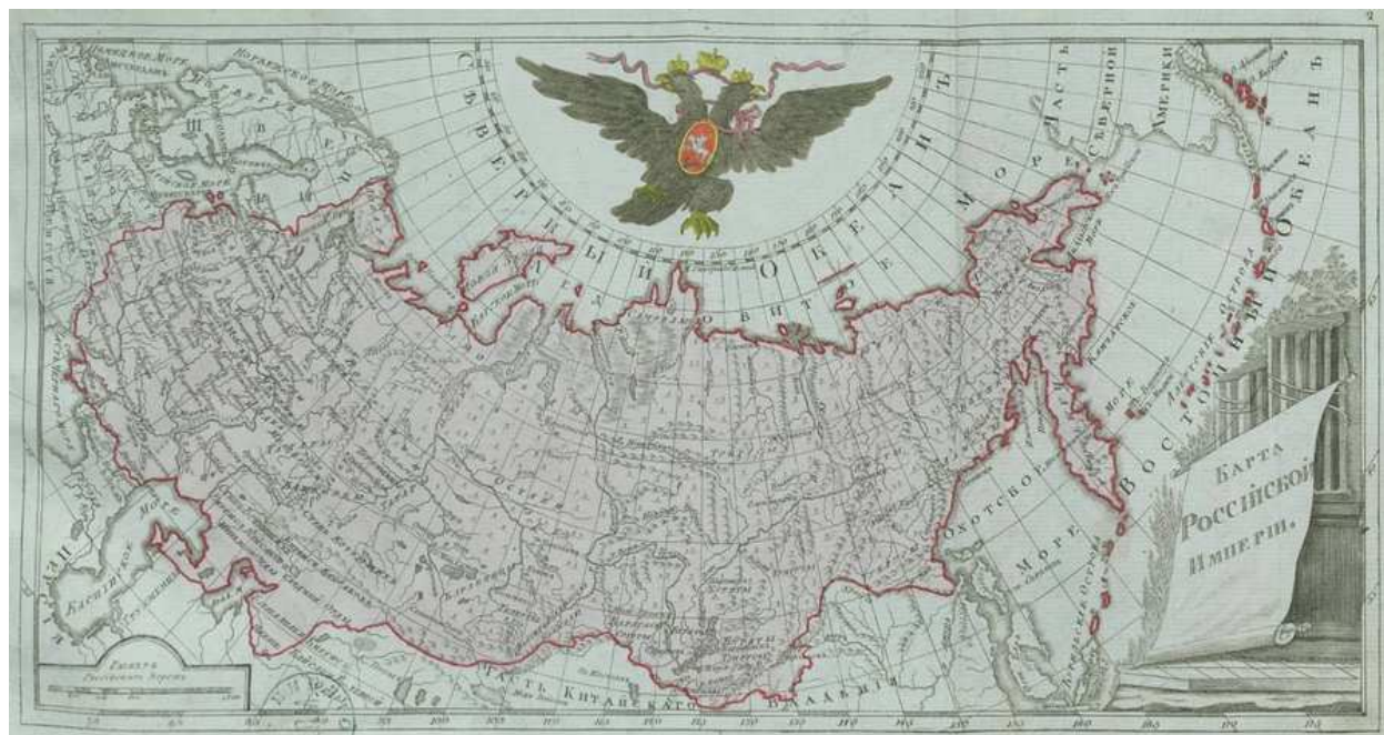
Рисунок 2 – Генеральная карта Российской Империи

В 1734 году был издан первый «Атлас Всероссийской Империи» И.Кириллова, а уже в 1745 был опубликован «Атлас Российский» (Атлас Империи) Российской академией наук, который состоял из одной общей (Генеральная карта Российской Империи) и девятнадцати специальных (карты уездов) карт в масштабе 285 верст в дюйме.