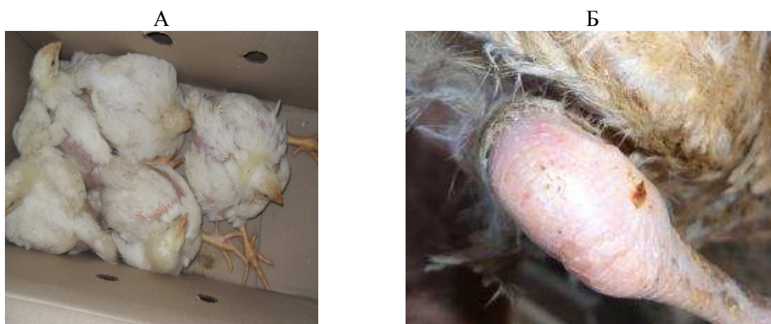
Рисунок 2 – Цыплята на 2-й день проявления артрита (А); сустав (артрит и гидрартроз) (Б)

Нашими исследованиями установлены аналогичные изменения крови у цыплят с артритом уже в первый день проявления патологии суставов (рис. 2).