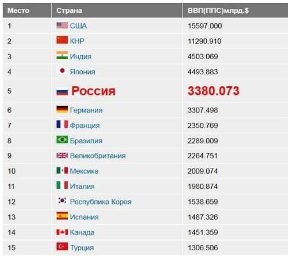
Рисунок 2 – Рейтинговые позиции стран по показателю «ВВП(ППС)» в мире за 2013 год [9]

объемах, главным образом для проведения спекулятивных операций и валютных интервенций [3].